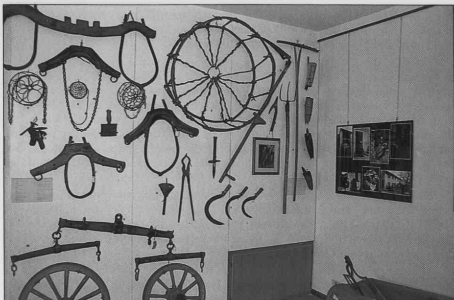
Pogled na del razstavljenе zbirke na Bukovju v Števerjanu (Foto Z. Vogrič, 1992)

katalogirali. Na zaključnem večeru tabora so prikazali zanimivo in bogato razstavo kmečkega in rokodelskega orodja.