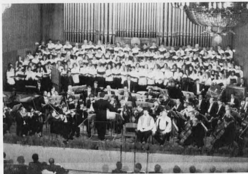
Sodelujoči pevci, orkester in solisti pri kantati Carmina burana

Predprodaja vstopnic v Katoliški knjigarni v Gorici