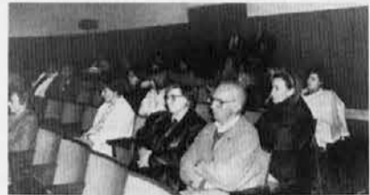
Občinstvo med predstavitvijo gledališke predstave DREVO NAD PREDPADOM, ki je potekala v nedeljo v štandreskem župnijskem domu v okviru Koroških kulturnih dnevov.

v različnih družbenih okvirih in državah. Dejstvo, da so se v Gorici v Katoliški knjigarni na otvoritvi dveh lepih likovnih razstav srečali najvišji kulturni in politični predstavniki iz Slovenije, Koroške in Furlanije - Julijske krajine, nam priča o tem, da je kljub razprtijam med Slovenci še vedno toliko narodnega ponosa in zavesti, da se zavedamo, kje so meje neumnih sporekanj in kje meje skupnega sodelovanja.