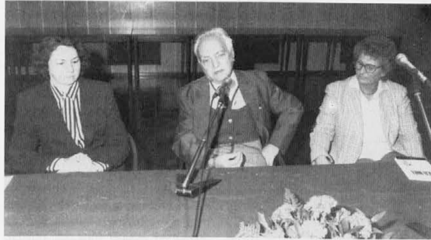
Pisatelj Alojz Rebula med predstavitvijo

Kulturni dom in Katoliška knjigar- na sta v četrtek, 6. oktobra, pred- stavila goriški publiki knjigo Alojza Rebule, ki nosi naslov Kačja roža. Knjigo je izdala založba Mihelač iz Ljubljane ob pisateljevi sedemdeset- letnici. Doslej so avtorja in knjigo že predstavili v Ljubljani in v Trstu, tokrat pa se je Gorica spet izkazala kot mesto, ki je hvaležno prizorišče vseh kulturnih predstavitev. V malo dvorano Kulturnega doma je namreč prišlo izredno veliko ljudi; bila je na- bito polna, veliko ljudi je ostalo brez sedeža. Ob prisotnosti pisatelja Aloj- za Rebule je knjigo Kačja roža pred-