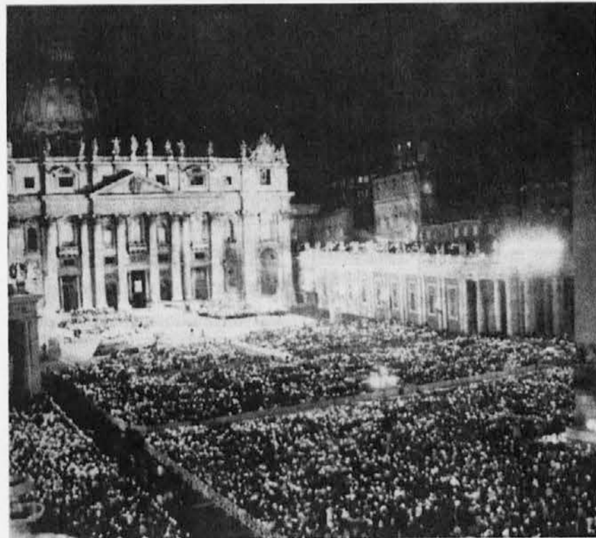
Množica na Trgu sv. Petra v soboto zvečer

V nedeljo zjutraj je bilo lepo gledati sveto mašo s trga svetega Petra; papež je bil — kot vedno — tako optimističen, da je »okužil« prisotne med Berninijevimi stebri in televizijske poslušalce. Zelo lepo je bilo, da je slovenska televizija neposredno prenašala papeževo maševanje celo nedeljsko jutro, tako kot je za to poskrbela večina svetovnih televizij. Vsi ljudje dobre volje so tako lahko gledali svetega očeta, ki