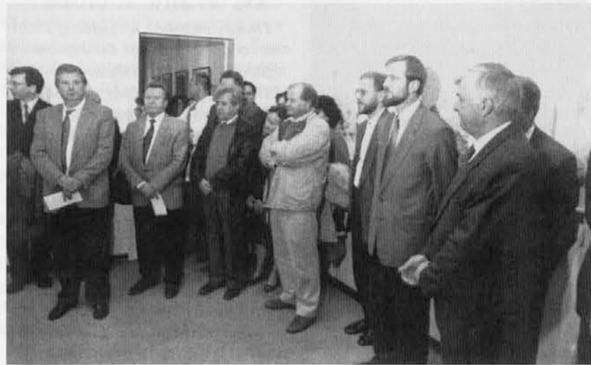
Posnetek z otvoritve razstave

Malokrat se zgodi, da se lahko organizatorji likovne galerije na Travniku pohvalijo s tako velikim obiskom ob vstopu v novo sezono. Že res, da sta tokratna likovna umetnika v Katoliški knjigarni dva Korošca, umetnika, ki sta prišla razstavljati v naše kraje v okviru 6. Koroških kulturnih dnevov na Primorskem. Pa vendar si upamo zapisati, da že dolgo ni bilo toliko ljudi in pomembnih osebnosti na Travniku, kot jih je bilo v petek zvečer.