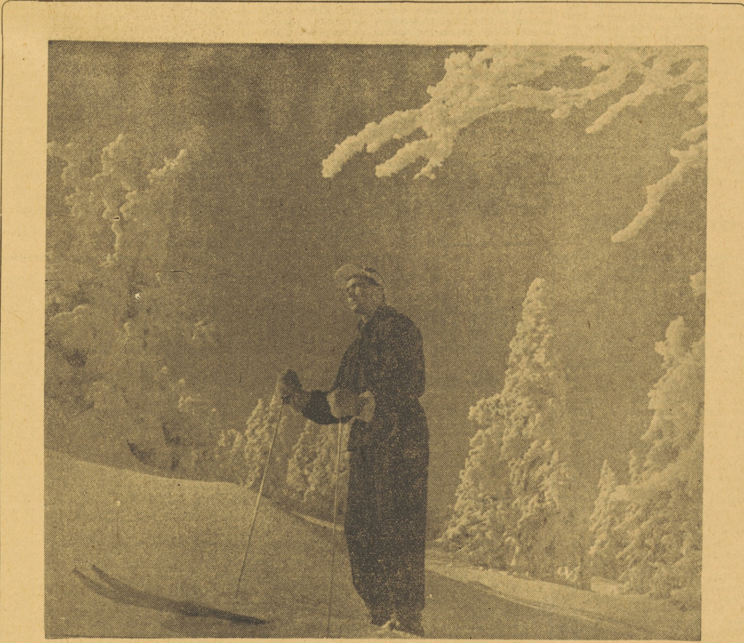
Smučarji so letos prikrajšani za marsikatero radost. Upajmo pa, da jim bo narava posej bolj naklonjena. (Za vse, ki jih smučanje zanima, objavljamo na 5. strani nekaj navodil)

S tem, ko je skupščina sprejela poslovnik in izvolila svoje stalne odbore, se začne prava delovno življenje Ljudske skupščine.