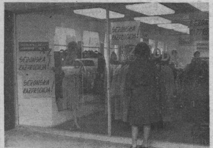
Novoletni prazniki so za nami, zima tudi ni nič kaj radodarna s snegom in mrazom, za pošteno izpraznjene denarnice pa so velike razprodaje, ki nam jih te dni ponujajo trgovine, še kako dobrodošle.