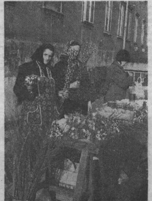
... pa teloh, ki ga te januarske sončne in tople dni ponujajo na trgu, oznanja, da se je na travnikih in v gozdovih že začelo prebujati spomladansko cvetje, čeprav smo še vedno sredi zime.