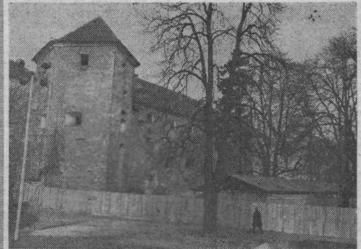
Zal pa se le otroci lahko brezskrbno igrajo v bližini ljubljanskega gradu, še posebno sedaj, ko je gradbišče ograjeno. Mestnim možem pa obnova gradu prinaša marsikatero skrb, še s čuvajstvom se morajo ubadati.