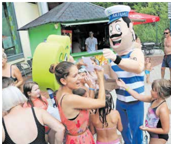
Navdušenje nad maskotami je bilo veliko, poskrbele pa so tudi za pobarvanke.

Od poletja pa so se v Termah Snovik poslovili ta konec tedna. Pripravili so pester program, ki je ponudil aktivno animacijo, druženja in dogajanje, kjer pa so na svoj račun prišli tudi starejši. Veselijo pa se že naslednjega poletja.