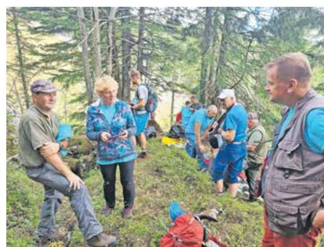
Sodelujoči na čistilni akciji po opravljenem delu