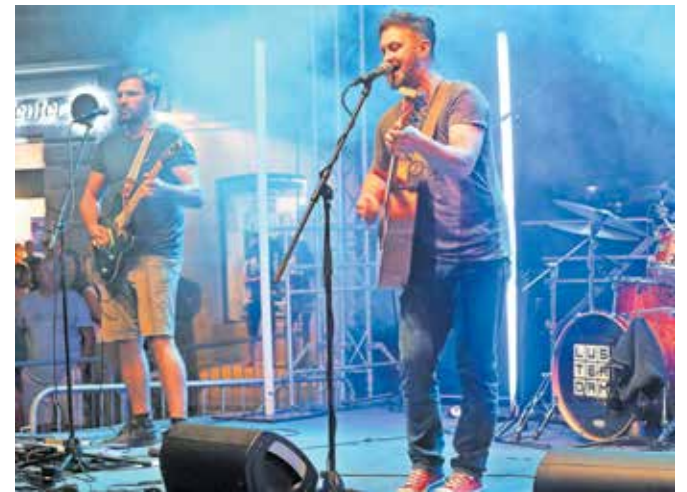
Po žilah Lusterdama se pretaka post-rok in kitarski pop s primesmi grandža in kantrija. Prisluhnilo ste jim lahko na Mestnem odru.