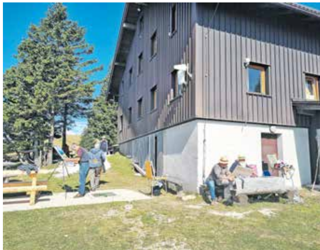
Na tridnevem mednarodnem bienalu je letos ustvarjalo devetnajst slikarjev.