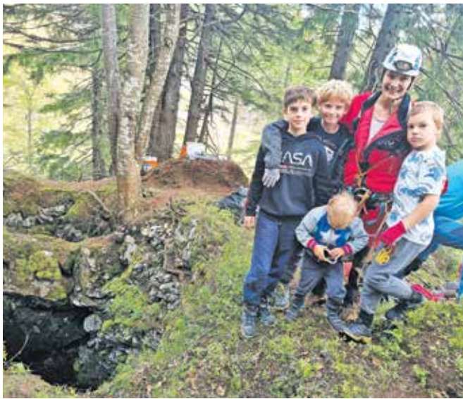
Pri čiščenju jame Vlečnica 1 so izkušenim jamarjem pomagali tudi najmlajši.

»Ta jama je bila po pripovedovanju pastirjev in lovcev znana po tem, da so vanjo odpadke nosili iz Velikega stana, pa tudi iz okrepčevalnice, ki je obratovala v časih, ko je po Tihi dolini še vozila vlečnica. Med odpadki, ki smo jih našli in odstranili, niso bili le takšni, stari nekaj desetletij, ampak tudi mnogo mlajši, kar dokazuje, da so odpadke sem nosili pred tudi še zgolj nekaj leti – odstranili smo namreč za več velikih vreč plastičnih odpadkov, steklenic, polivinila, pločevink ... Vseeno je bilo tega manj, kot smo pričakovali, in čiščenje smo končali v manj kot dveh urah. Pozna se, da je ta jama vendarle precej od rok – iz Kofc smo izvlekli celo stare štedilnike, česa takega tu k