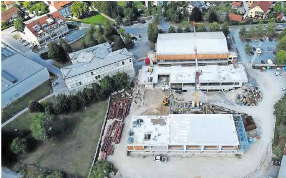
Največja investicija na področju vzgoje in izobraževanja je gradnja nove šolske stavbe OŠ Frana Albrehta.

Kot so nam našli, so na POŠ Tunjice uredili kuhinjo v vrednosti dobrih 10 tisoč evrov in z nakupom šolskega pohištva uredili dodatno učilnico v prostorih bližnjega gasilskega doma. Zaradi zagotavljanja prometne varnosti za učence, ki bodo obiskovali pouk v domu PGD Tunjice, bo občina na tem območju izvedla omejitvene ukrepe, ki bodo opozarjali voznike na spremembo prometnega režima. V stavbi POŠ Mekinje so zamenjali notranja vrata. Na OŠ Marije Vere so v kabinetu, kjer se izvaja dodatna strokovna pomoč, zamenjali talno oblogo, prav tako so talno oblogo zamenjali tudi v učilnici 5. razreda. Opravili so tudi slikopleskarska dela in zamenjali omare. Na športnem igrišču pri POŠ Motnik so zamenjali zaščitne mreže. Še vedno pa potekata sanacija temeljev šolskega objekta in ureditev hidroizolacije. Za preprečitev zastajanja meteoritnih vod ob objektu se izvaja drenaža ob temeljih. V teku je zamenjava dela žičnate ograje na športnem igrišču pri OŠ Šmartno v Tuhinju s panelno ograjo, skupaj s stebri in vrati. Na OŠ Toma Brejca so kupili stroj za čiščenje, opravili pa so tudi temeljito čiščenje steklenih površin. Kupili so tudi mize za jedilnico in pisalne mize s predalniki. Na OŠ 27. julij so