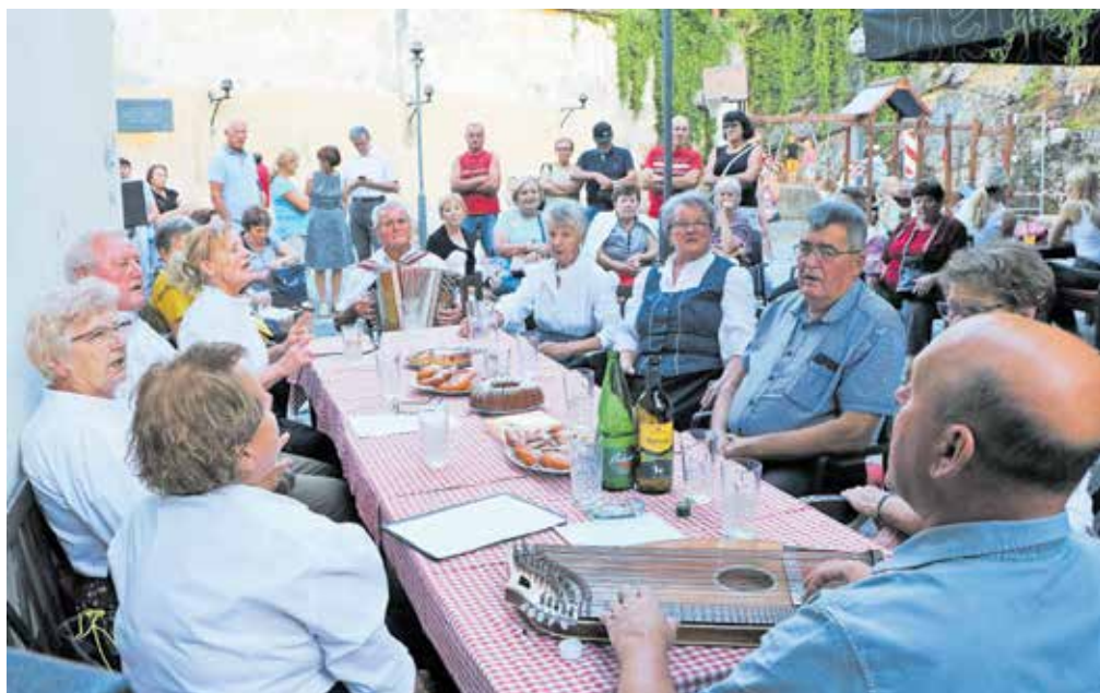
Seniorski večer

»Dvajset let bo minilo od trenutka, ko smo se odločili in na Malograjski hrib znošili lesen oder, ki so nam ga dobrohotno posodili tuhinjski kulturniki. Tudi prihajajoči Kamfest bo v znamenju solidarnosti, sodelovanja in novonastajajoče kamniške kulturne strategije,« zaključuje vodja programske festivalske ekipe.