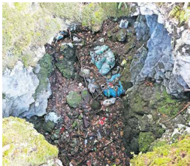
Odpadke, ki so se vrsto let zbirali v jami, so jamarji odstranili in odpeljali v dolino.

Tudi letos kaže tako, saj se je na jamarskem taboru ena od skupin jamarjev podala v raziskovanje nove jame, ki naj bi bila na območju planine Konjščica.