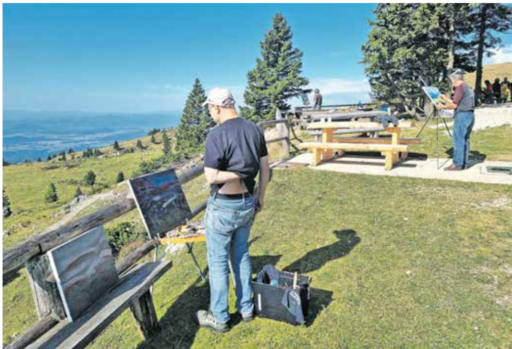
Likovni bienale Velika planina

»Nazadnje smo bienale pripravili pred štirimi leti, saj je srečanje pred dvema letoma zaradi epidemije odpadlo. Letos smo povabili devetnajst umetnikov, vrhunskih slikarjev, tako akademskih kot ljubiteljskih, s katerimi se že dlje časa srečujemo in tudi sodelujemo. Večina jih je domačih, tudi več Kamničanov, trije pa prihajajo tudi iz tujine – dva iz Bosne in Hercegovine, eden pa iz Rusije,« nam je povedal predsednik KUD Tone Kranjc Kamnik in glavni