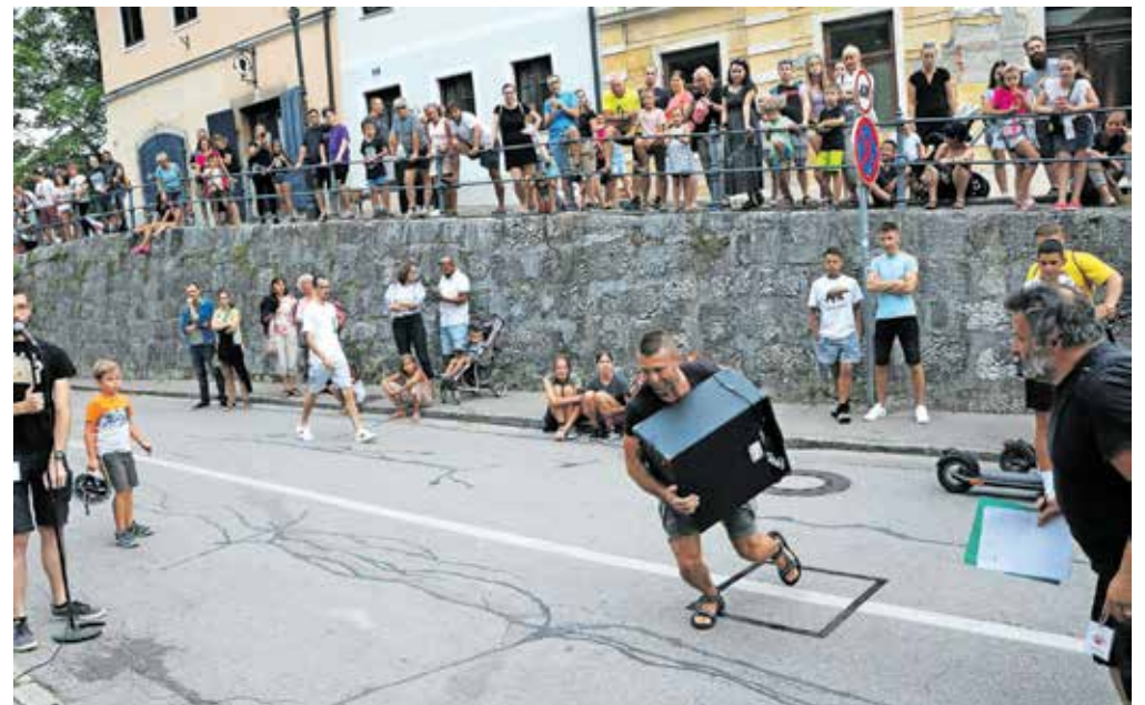
Tek s »feršterkerjem«