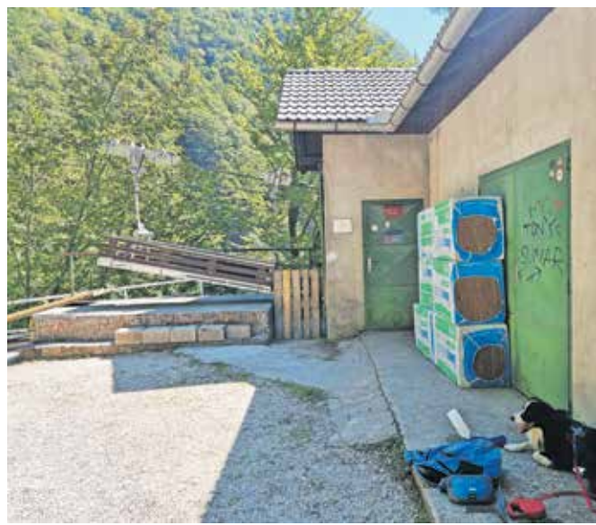
Ves stari in novi gradbeni material so s koč in do njiju prepeljali s tovorno žičnico; na sliki žičnica na Kamniško sedlo.