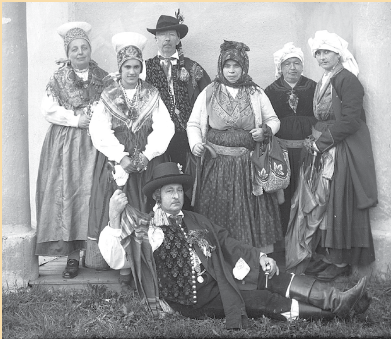
Kamničani v narodnih nošah, med svetovnjima vojnoma

Marsikdaj. Še vedno gre za preobleko, ki je primerna za protokolarne namene, z njo dajemo prireditvam poseben pomen. V mednarodnem okolju velja kot primerna obleka diplomatov, ljudi, ki se oblečejo v narodno nošo, pa smo veseli na kulturnih prireditvah, na državnih, cerkvenih, občinskih in drugih slavnih. Nedvomno z njo lahko popestrimo tudi osebna slavlja in dogodke, ki so pomembni v lokalnem okolju.