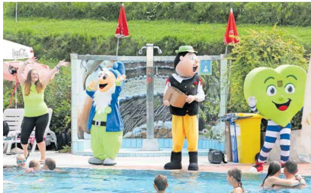
Palček Snoviček je s prijatelji vabil na plesno delavnico.