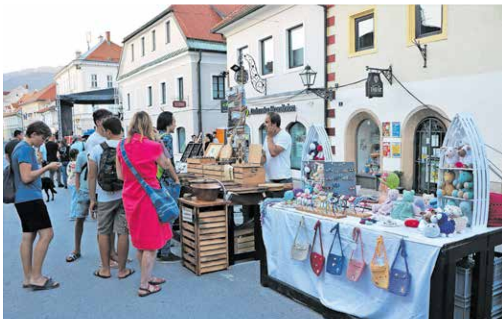
Sejem unikatnih izdelkov že vrsto let lepo vsebinsko dopolnjuje festivalski program.