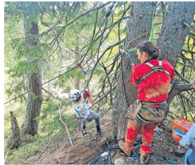
Najmlajšim jamarji tudi na tak način želijo približati lepote svojega dela in pritegniti njihovo zanimanje.

»Jame iščemo tako, da najprej prisluhnemo pripovedim domačinov – v tem primeru predvsem pastirjem in lovcem, ki teren zelo dobro poznajo. Sicer pa sistematično prečesavamo teren, ki je zelo zahteven. Gre namreč za kraški teren. Jama oz. brezno namreč pogosto vidiš šele, ko že skorajda padeš vanj. Pozimi nam veliko pomagajo meglice, ki se dvigajo iz takšnih lukenj in dajo slutiti, da se spodaj skriva neki večji prostor. Včasih tudi na tak način odkrijemo kakšno novo jamo. Vhodi so pogosto komaj zaznavni, tudi zato, ker se zaradi krušljive kamnine jame velikokrat sesedejo same vase, a v globinah se skrivajo veliki prostori. Jama Kofce v dolžino denimo meri skoraj kilometer,« nam še razloži eden najbolj aktivnih jamar-