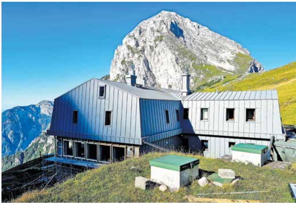
Kamniška kočica na Kamniškem sedlu je letošnje poletje zaradi energetske prenove dobila novo zunanjo podobo.

Dela na Kamniškem sedlu so se začela v zadnjem tednu maja, takoj ko so vremenske razmere to omogočale, zaključila pa se bodo v teh dneh. Delavci so najprej odstranili pločevinasto strešno kritino in fasado, vgradili dodatno toplotno izolacijo, namestili novo strešno, na severni del pa tudi fasadno