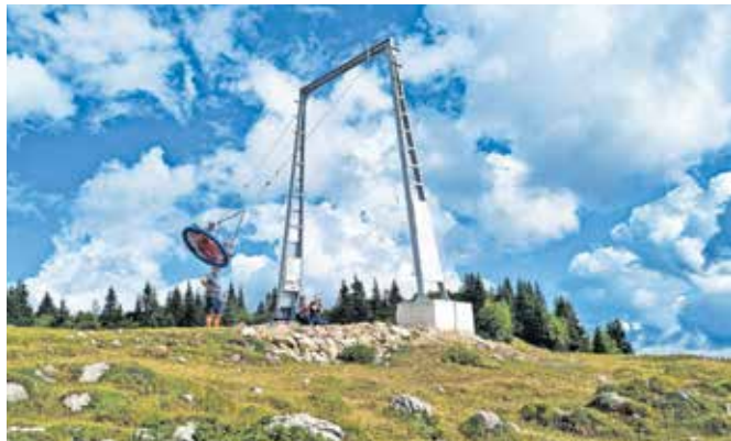
Tri gugalnice velikanke so nameščene na stebre nekdanje žičnice.