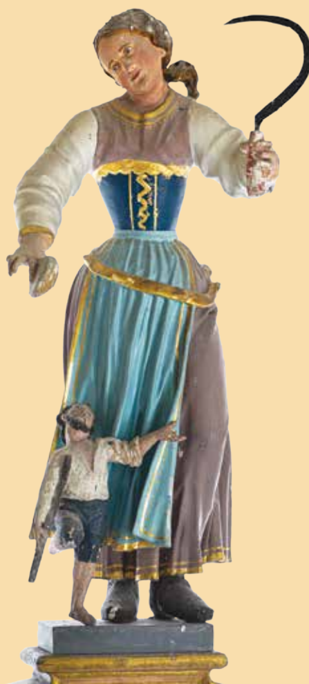
Kip svete Notburge v podružnični cerkvi sv. Lenarta v Zakalu se povezuje s podobo praznjega oblačenja žensk kamniške okolice.

Posebna pričevanja o oblačenju v lokalnem okolju prinašajo nekatere upodobitve v cerkvah, večinoma v prizorih, ki upodabljajo ljudi v stiski. Poleg fresk v cerkvi sv. Primoža in Felicijana z začetka 16. stoletja so zanimive baročne upodobitve svete Notburge in svetega Izidorja – kmeta v cerkvah na Selih in v Tunjicah, posebno vrednost pa imata doslej neopažena kipa teh dveh svetnikov v podružnični cerkvi sv. Lenarta v Zakalu. Sveto ob straneh glavnega oltarja, so odseva tudi pesemsko izročilo. s kmečkim delom, zato njune iz okolja, kjer so nastale. S tem so se namreč ljudje s svetnikoma še lažje poistovetili.