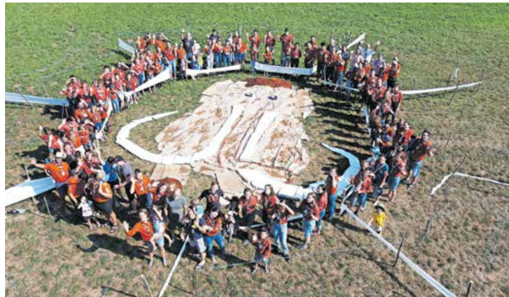
Kamniški skavti ob veliki sestavljanji s podobo mamuta

Sobotno jutro je bilo povsem običajno: budnica, jutranja telovadba, zajtrk in kvadrat. Kvadrat pomeni, da se vsi skavti postavimo v vrsto v obliki pravokotnika. Za sklic kvadrata je potreben pose-