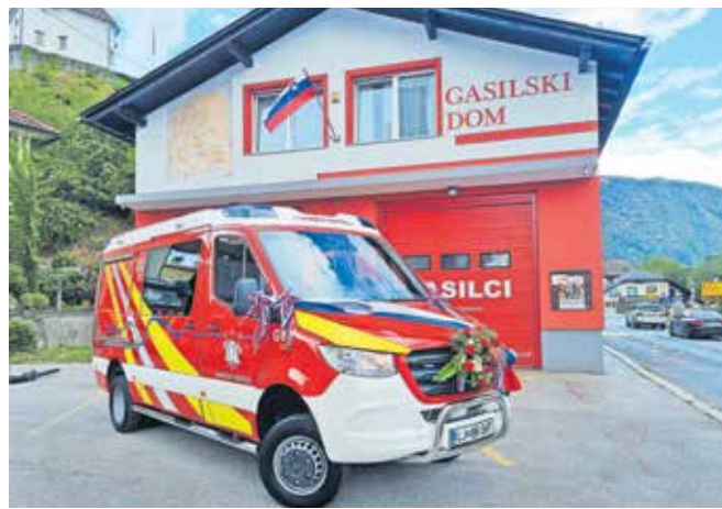
Novo vozilo PGD Kamniška Bistrica

orodja tudi nova in sodobna prenosna motorna črpalka znamke Rousenbauer FOX S, ki bo zamenjala staro »rosenbauerco«, ki je bila v društvu vse od leta 1969. Novo vozilo bo na različne intervencije na območju delova-