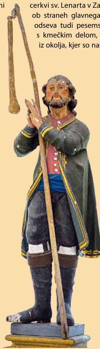
Podoba svetega Izidorja, zavetnika kmetov, v oltarju cerkve v Zakalu upodablja praznje oblačenje moških v kmečkem okolju, zlata obroba suknje pa poudarja plemenitost svetnika.