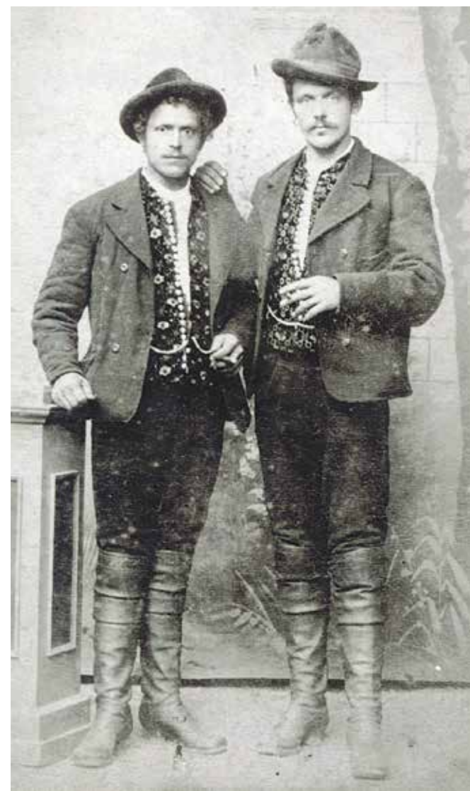
Moška iz Doline nad Trzičem, konec 19. stoletja

Ženski na desni imata pečo prekrizano na zatilju in na vrhu glave zavezano v pentljo. Tak način zavezovanja peč je bil pogost v prvi polovici in sredi 19. stoletja, na njeni podlagi pa se je v zadnji tretjini 19. stoletja s pečami, ki so jim dodajali široke čipke, razvila petelinčkova vezava.