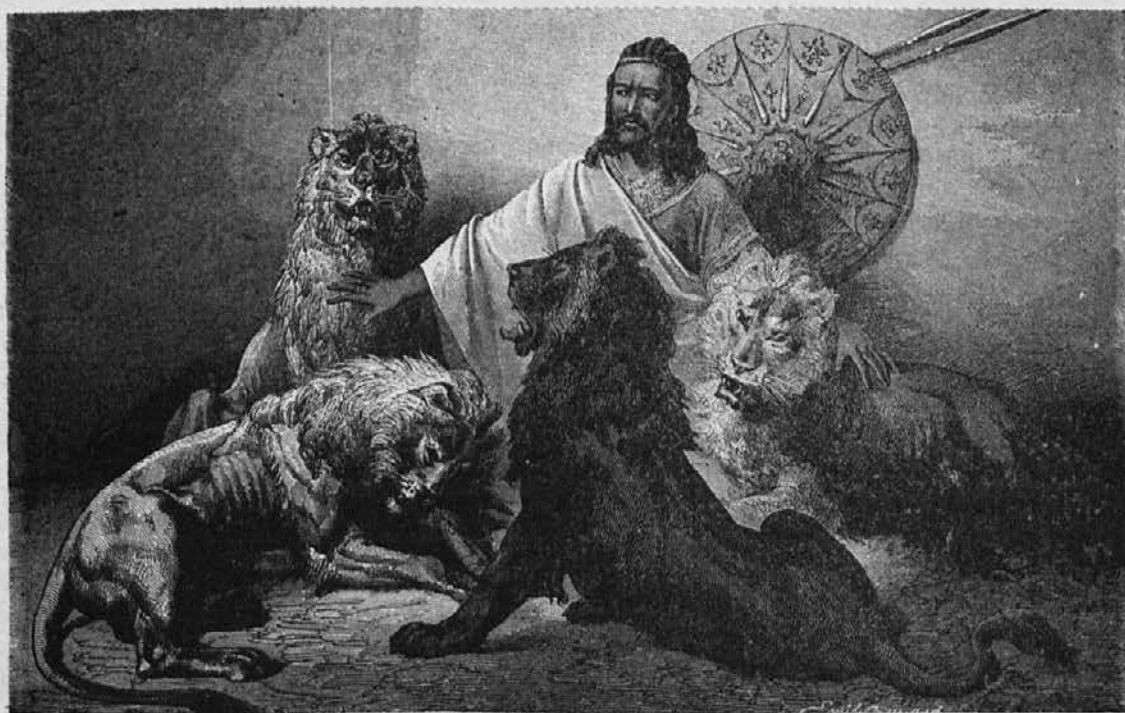
V sredi v zlati skledi? — Naka!