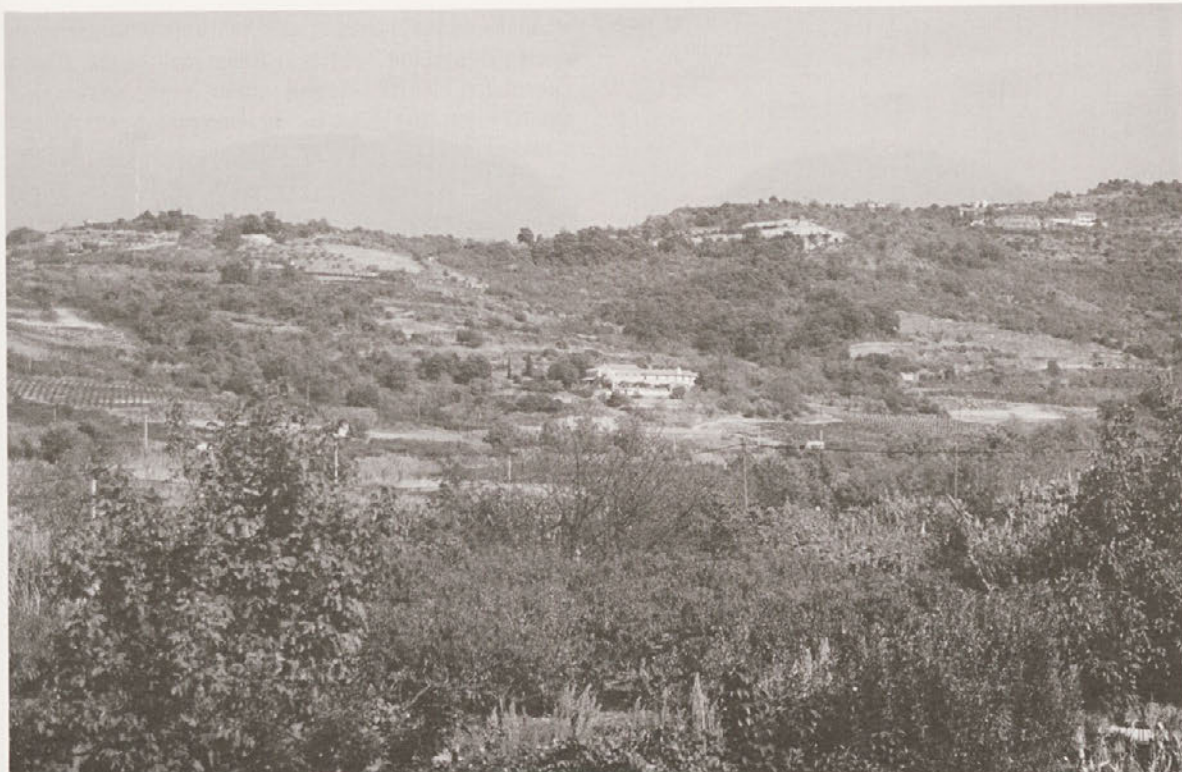
Pogled na posestvo in okolico z južne strani