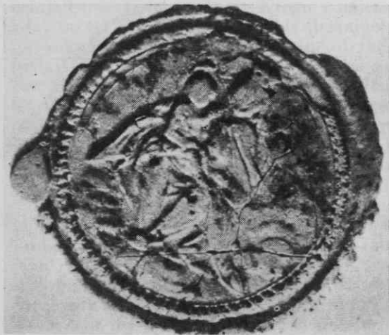
Pečat györskega kapitlja na listini o cerkveni desetini v Krogu z dne 7. VI. 1847: Marija s krono na glavi je obrnjen na na svojo desno stran; v naročju drži otroka Jezusa

Toda za razjasnitev lokalizacije nam more služiti podatek iz l. 1627, ki navaja krajevno ime Buzincz v bližini Murske Sobote. 30 Vizitacijski zapisnik iz l. 1627 pravi, da je soboški kantor (ludimagister) dobival bero v vaseh: v Krogu, Buzincih in v Lukačoveih.