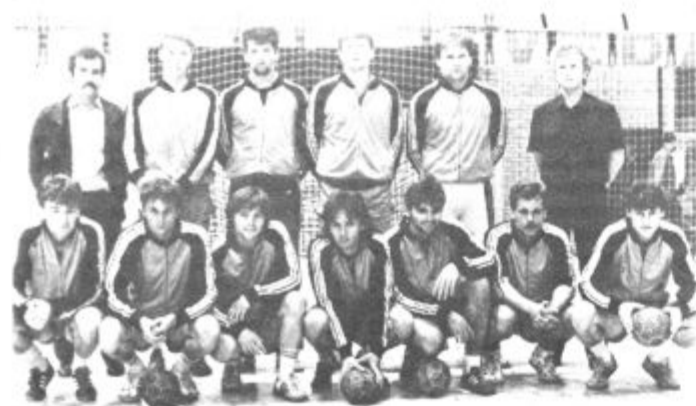
Ekipa Šoštanja. Je tretje mesto uspeh ali neuspeh?

Ob tekmovanju za državno prvenstvo v moto-crossu bo višek nedeljske prireditve tudi blagovna loterija. Srečke zanjo so že v prodaji, veljajo pa tudi za vstopnico. Nagrade so lepe. To je Zastava 128, motorna kolesa BT-50, moška, ženska in otroška dirkalna kolesa, dopust na Kornatih za 3 osebe, potovanje na Češko in podobno. Prireditelji so posebej poskrbeli za prometno varnost. Vožnja bo enosmerna, vozila pa bodo ustavljali šele na parkiriščih, dokler seveda ne bodo zadovoljena. Zato si želijo, da bi bližnji obiskovalci prišli prej in peš, nekaj rekreacije namreč tudi ne škodi. Poskrbeli so tudi za avtobusne prevoze. Avtobusi bodo vozili od 13. ure dalje iz Titovega Velenja po krožni progi. Kakorkoli že, v nedeljo bo na Trebeliškem za vsakogar nekaj, od športnih užitkov, do zabave in razvedrila, za srečneže pa veliko lepih dobrot.