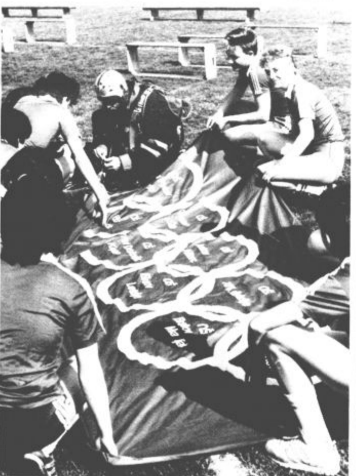
Olimpijska zastava — devet osnovnih šol, devet krogov