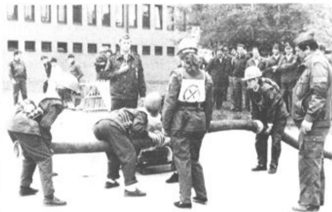
Nastopilo je 26 ekip

nih skupnostih pa so se najbolje odrezali tekmovalci iz Stare vasi, druga je bila moška desetica Šentilja, tretja pa ekipa Čirkovc. V tekmovanju z motornimi brizgalnami je med združenimi odredi slavil združen odred civilne zaščite Šoštanj pred Velenjem in Pesjem, pri delovnih organizacijah sta nastopili v tej disciplini dve. Boljši so bili tekmovalci tovarne usnja Šoštanj pred DO Gorenje. Med krajevnimi skupnostmi pa so z motorno brizgalno delali najhitreje tekmovalci iz Lokovice, druga je bila ekipa krajevne skupnosti Gaberke, tretja pa moška desetica