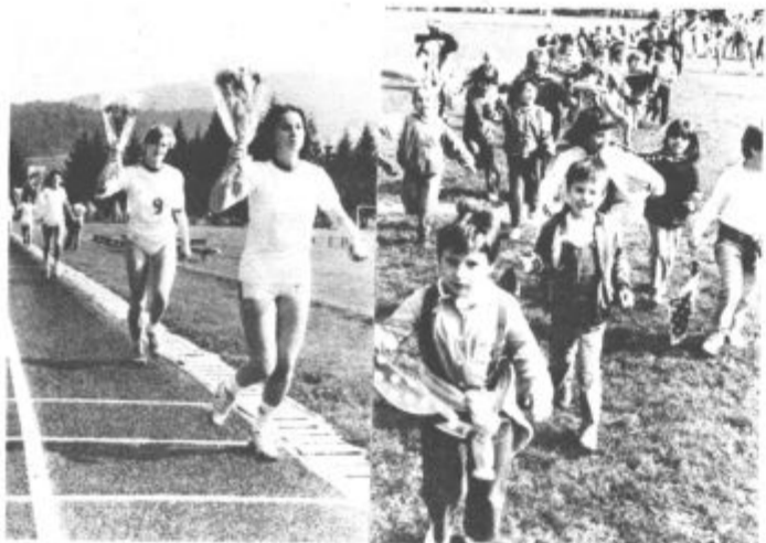
Sopki cvetja v Titov spomin. Predstavili so se tudi cicibani

Velenjski Rudarski oktet nadaljuje srečanje s tovrstnimi okteti od drugod. Jutri (petek) ob 20. uri bodo priredili v dvorani Glasbene šole v Titovem Velenju novo srečanje. Poleg njih bosta na njem zapela še oktet Tosame iz Domžal ter Šaleški oktet, kot gostje pa Ukrajinski deklinski zbor iz Belorusije.