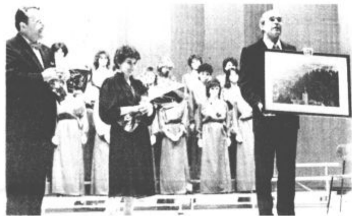
Ob jubileju številna priznanja