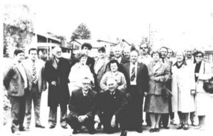
Gostje z Grip skupaj z gostitelji, ki jim bodo jeseni vrnil obisk

Prijave za udeležbo na manifestaciji »Po poteh Bračičeve brigade« sprejema osnovna organizacija ZSMS Stara vas Titovo Velenje, zadnje prijave pa bodo organizatorji sprejemali še soboto, 30. maja do 8. ure.