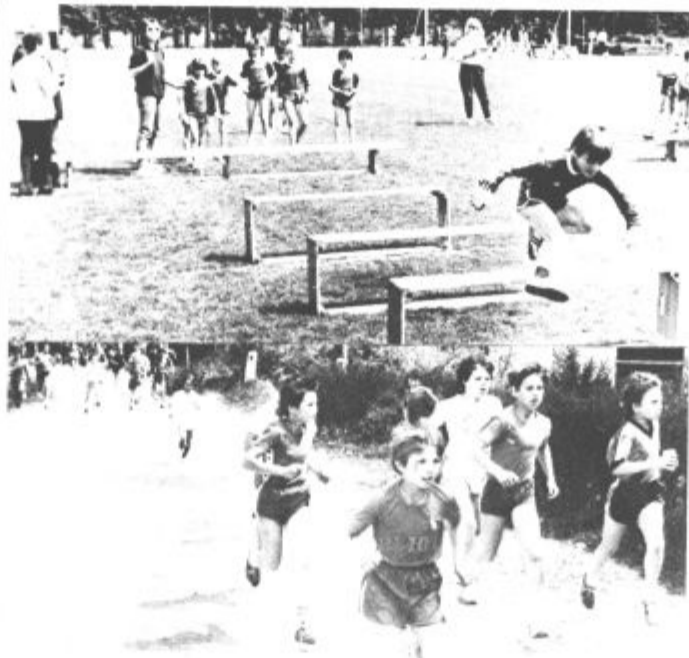
Nižji razredi so tekmovali v poligonu in krosu

Začeli so z mimohodom. 360 učencev v devetih skupinah, kolikor je vseh osnovnih šol, pred njimi pa še skupina sodnikov. In medtem ko so se ustavili pred slavnostno tribuno, so iz letala izskočili padalci ptujkega aerokluba ter na igrišče prinesli olimpijsko zastavo in našo trobojnico. Mladi, med njimi je bilo tudi