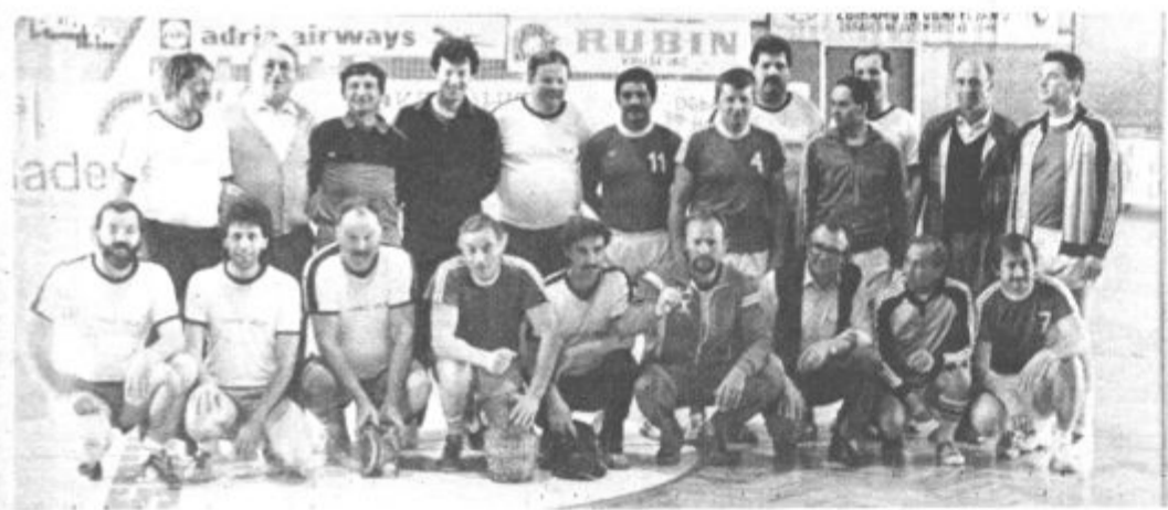
Pred začetkom srečanja v malem nogometu tudi obvezen spominski posnetek