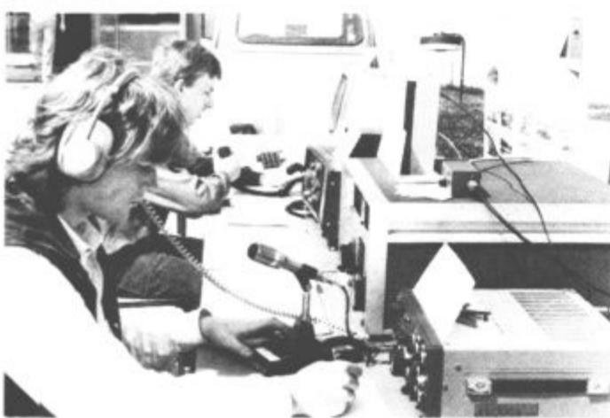
Pokazali so aparature, od najstarejših do najmodernejših — b. m.

SEKCIJA RADIOKLUBA HINKO KOŠIR NA CSS — V času na široko odprtih vrat Centra srednjih šol v Titovem Velenju so med drugimi predstavili šolske in izvenšolske dejavnosti svoje delo prikazali tudi člani sekcije radiokluba Hinko Košir. Razstavili so aparate od najstarejšega do najmodernejšega, na vseh pa so povsem samostojno vzpostavljali zveze dijaki CSS sami. Tudi sicer radioklub Hinko Košir uspešno sodeluje s centrom, zlasti ko je treba izračunavati potrebne podatke z najrazličnejših tekmovanj.