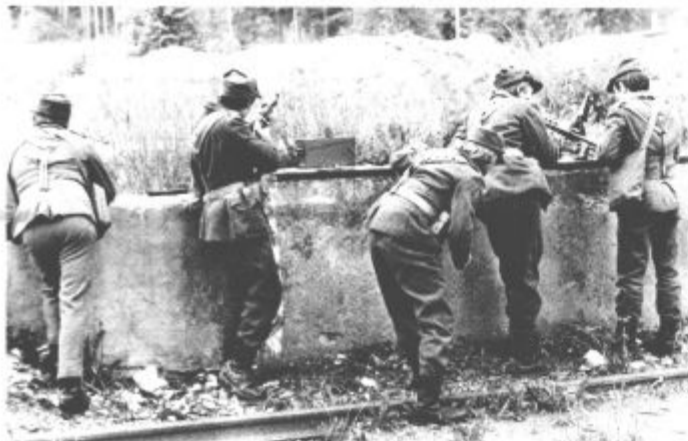
Diverzanti so bili deležni močnega in ognjevitnega odpora