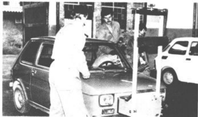
Na tehničnih pregledih je bilo veliko dela

Seveda laskavih ocen ne zaslužijo vse načrtovane akcije. Posvet s predstavniki krajevnih skupnosti o varnosti v cestnem prometu je odpadel, pionirjev — prometnikov v ponedeljek ni bilo na križiščih, učne ure na nekaterih osnovnih šolah o prometni vzgoji so bile brez strokovnega vodstva, zato so se učitelji in učenci znašli, kakor so vedeli in znali. Ko bomo prihodnje leto znova pripravljali program tedna varnosti v cestnem prometu, bomo morali biti bolj pozorni do teh, na videz manj pomembnih napak. Zlasti odgovorni za posamezne naloge bodo morali biti bolj odgovorni in dosledni. B. Mugerle