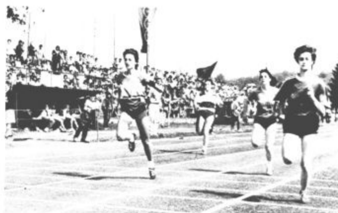
Odločali so centimetri