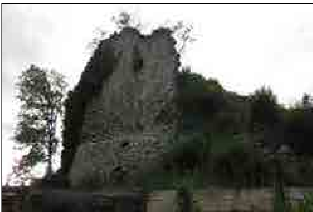
Stari grad Dobrna z zdraviliščem po G. M. Vischerju leta 1681 (Vischer, Topographia, sl. št. 105) in danes (foto: B. Golec, julij 2011).

ležeči grad ali dvorec. Funkcije prvotnega gradu neredko niso prenehale vse hkrati, tako da bi grajski kompleks opustili kar čez noč, ampak so jih v novi, praviloma istoimenski dvorec prenašali postopoma.