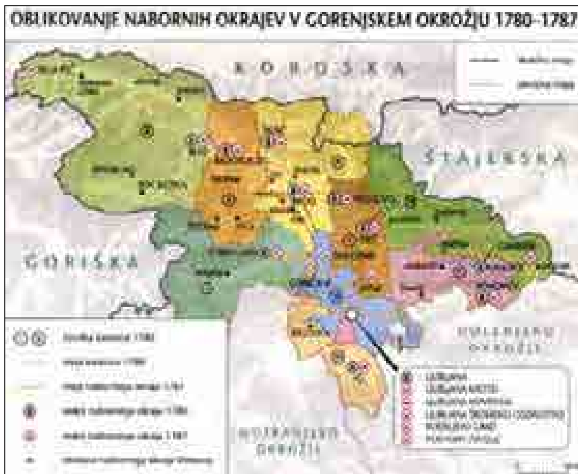
Oblikovanje nabornih okrajev na Gorenjskem 1780–1787 (Bajt, Vidic (ur.), Slovenski zgodovinski atlas, str. 121).

sodstvo pa so v celoti podržavili, tako da so izvajanje njenih nalog prenesli na državne organe in državne uradnike. 11 Gradovi kot taki, zlasti podeželski, so tako v zelo kratkem času izgubili skoraj vse dotedanje funkcije, ki so ugasnile oziroma so jih zdaj dokončno preselili v urbana in polurbana središča. Vendar so grajske zgradbe ponekod, če so se za to pokazale potrebe in možnosti, uporabljali za državne urade ter za sedeže novonastalih modernih občin in drugih uradov, deloma vse do danes. Novim upravnim in sodnim organom je lahko streho redko nudil grad, ki je stal na samem oziroma v povsem podeželskem okolju. Tak je bil med drugo svetovno vojno požgani grad Brdo pri Lukovici, do leta 1942 sedež okrajnega sodišča. 12 Novonastala oblastva bomo, nasprotno, pogosteje srečali v gradovih, ki stojijo v trških in mestnih naseljih. Tako so stari žu