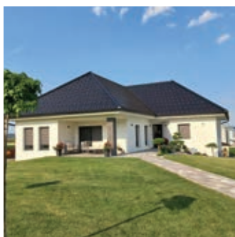
• DRUŽINA KOSEC, LEVANJCI 1a