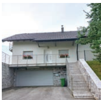
• DRUŽINA KRAMAR-TOLIČIČ, JANEŽOVSKI VRH 16a