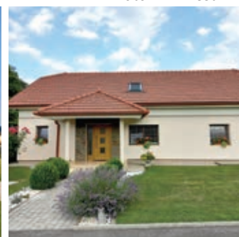
• DRUŽINA ČEH, SVETINCI 15