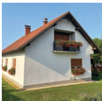
• NEŽKA IN EMICA FLAJŠMAN, DOLIČ 32