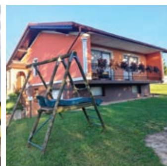
• DRUŽINA ČUČEK, GOMILCI 11a