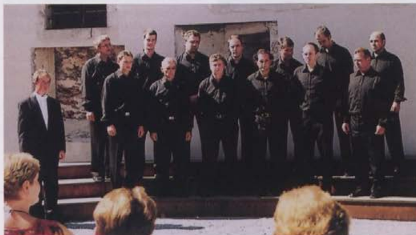
Pevski zobri so se srečali na Bistri pri Vrhniku.

Dogodek se je zgodil 21. septembra 2003, na Gradu Bistra pri Vrhniku,