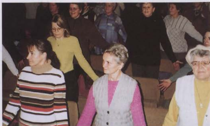
Po vsakem predavanju je nekaj minut namenjeno tudi telesni vadbi.