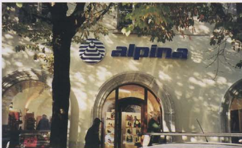
Že na zunaj se vidi, da imamo sodobno, a arhitekturno zanimivo prodajalno.

V prodajalni v Novem mestu so zaposleni štirje delavci. Poslovodja