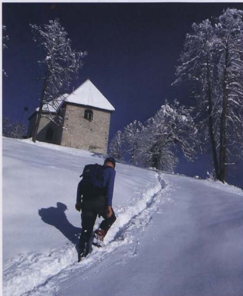
Priložnost za darilo: prvi korak v vsak s hojo poživljen dan.

Če je odločitev še vedno težka, tik pred zdajci predlagam še tele spod-