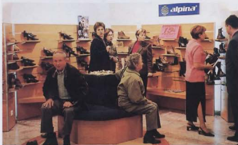
V prodajalni se je takoj po odprtju zbralo mnogo kupcev.

Nekoliko nas moti le, ker nimamo več toliko skladiščnega prostora. Upamo pa, da v današnjih pogojih,