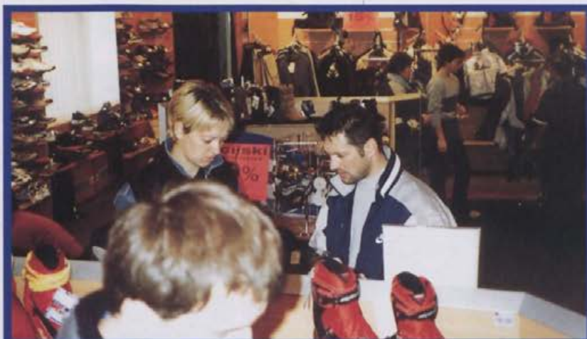
Tudi letos se je Alpina udeležila smučarskih sejmov, vsej po Sloveniji. Utrip ob smučarskem sejmu je bil zabeležen v prodajalni Žiri 2.