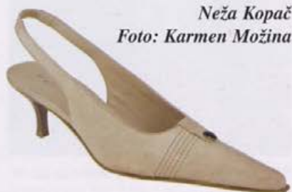
Neža Kopač

lahko poiskali obutev za elegantne priložnosti, udobno obutev za prestajanje vsakodnevnih naporov in obutev za sproščeno preživljanje prostega časa.