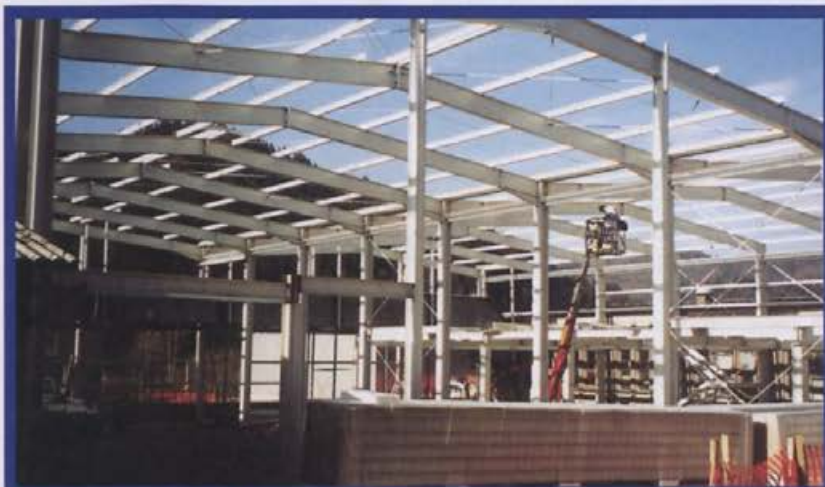
Nova skladiščna hala dobiva svojo podobo.