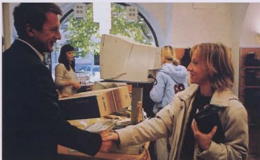
Komercialni direktor je čestital za prvi izbrani par.

ko imamo možnost, da zeleno blago zelo hitro dobimo v prodajalne, ne bo večjih težav. Že večkrat sem razmišljal o tem, da bi bilo dobro, da bi imeli v skladišču v centrali vedno na razpolago nekaj najbolj iskane obutve, ki bi jo lahko po potrebi pošiljali v prodajalne.