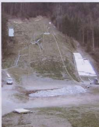
Dela pri novem skakalnem centru v Račevi so v zaključni fazi.

Mlajši skakalci so trenirali in tekmovali na skakalnicah po Sloveniji. V oktobru smo opravili tudi kakovo-