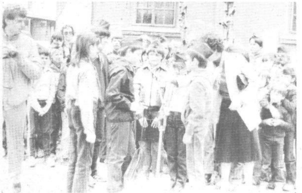
Viški pionirji predajajo torbico pionirjem iz Centra. V njej je dnevnik, v katerega pionirji vpisujejo čas in kraj predaje in v kratkem opisu vse pomembnejše akcije, ki so jih ob Kurirčkovi pošti opravili.