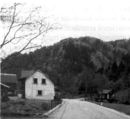
Nekdanja vojašnica na Zalem Logu