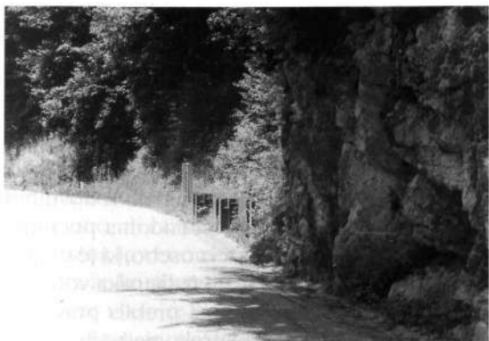
Ostanki zapornice pri Davškem mostu

po dolini predvsem apno, cement in železje. Enako se je dogajalo v Poljanski dolini, kjer so gradili cesto od Zminca preko Žetine do Kala. Bila je že tudi trasirana na vrh Blegoša, kar pa je preprečil razpad Jugoslavije. Gradili so prepreke na Hlavčjih njivah in številne bunkerje po Blegošu, ki stojijo še danes. Kako je potekalo "utvrđivanje" od Jesenovca preko Prtovča in Ratitovca, ne vem. Le to je bilo znano, da je bila cesta s Prtovča