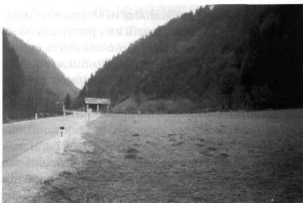
Travnik v Njivah, kjer so bile vojaške barake in skladišča. V Soro, ki teče tik ob glavni cesti, so napravili mostovž z betonskima podstavkoma, na katerem so prali tovornjake