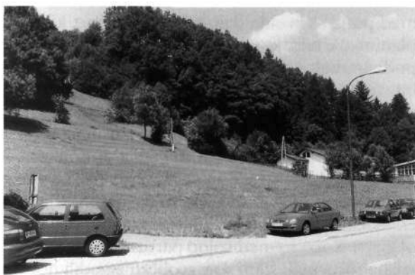
Senožet v Otokih (nasproti Domela), kjer naj bi bil cestni odcep za Prtovč

lo predvsem za Slovence. V nasprotju z njimi so bile srbske družine ponosne, če so bili sinovi v vojski. Mladim častnikom od podporočnika do kapetana ali podpolkovnika je bila poroka prepovedana, ako niso prej vplačali kavcije 30.000 dinarjev, kar je bila tedaj zelo velika vsota. 1 Kavcije niso nikoli več videli. Zato so iskali samo bogate neveste, ki so z doto lahko poplačale neznanke zahteve države. Poznala sem