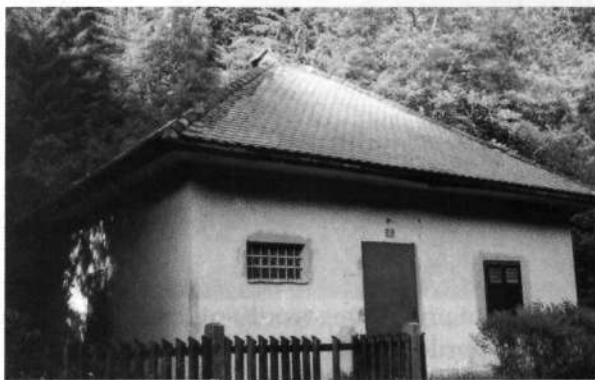
Karavla pod Petrovim brdom