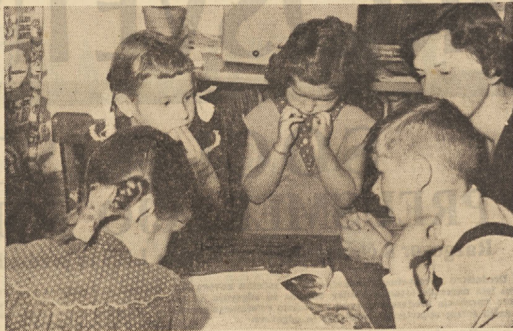
S skupnimi močmi pa niso nerešljivi tudi najtežji problemi