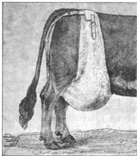
Sl. 28. Podveza bolnega vimena s pomočjo rjuhe. Konce zvežemo na križu.

Vse drugače nevarno je pa hudo ali akutno vnetje vimena, pri katerem je notranjost vimena, namreč ena ali več mlečnih žlez prizadetih, in katero lahko imenujemo z ozirom na zle posledice tudi gnojno vnetje vimena, ker se prizadeta žleza ognuji in nam dotični sesek lahko oglušči. Vneta mlečna žleza se namreč rada usuši, tako da ni več za molžo. S tem izgubi krava seveda veliko na svoji vrednosti, ker je z gluhim seskom manj porabna za molžo. Res, da pride za to nekaj več delovnosti na ostale seske, vendar se močno pozna izpadek mleka od cele četrti vimena, kajti zelo zelo redki so slučajji, da se gluh sesek zopet oživi ob prihodnji otelitvi.