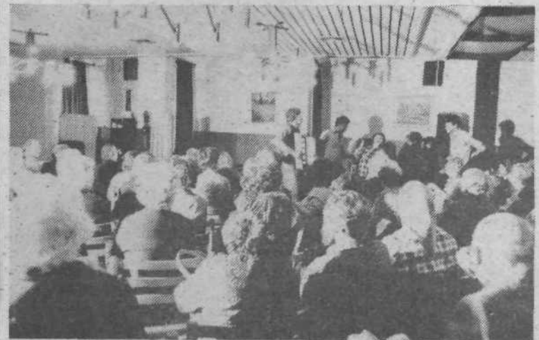
V domu upokojenecv na Taboru so 13. oktobra 1982 pripravili tri enodejanke. Zaigrali so kar oskrbovanci sami. Med odmori so zapeli ob harmoniki, po končani predstavi pa so se jim pridružil še gledalci.

Po nadvse plodni razpravi so si vsi predstavniki na kraju samem ogledali, kaj naj bi čimprej ukrenili za lepše in bolj urejeno okolje v samem srcu našega mesta.