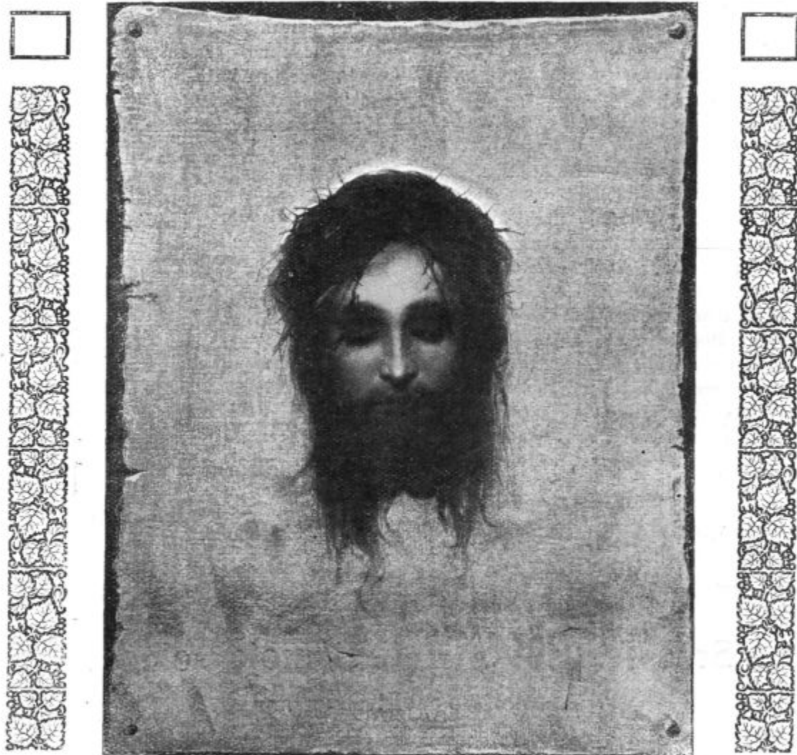
Sv. obličje Zveličarjevo — usmili se nas!

Ravnotako vzvišeni so pa tudi naši krščanske ljubezni. Sv. Vincencij jih je tudi nekega dne prav živo in praktično naslikal: »Če pogledam ubožca samo s svetnimi očmi (kakor ga pogleda in sodi posveten človek), potem bi pogosto opazil toliko dušnega gorja in zanemarjenosti, toliko telesne revščine in pohabljenosti, da