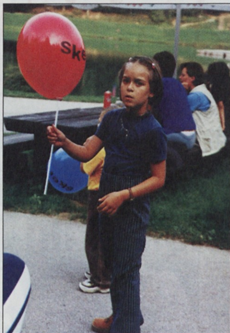
SKEI stoji na mladih.