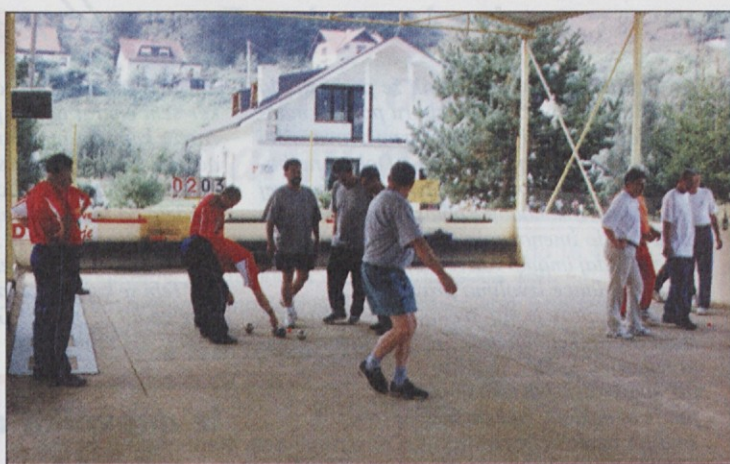
Najdalj je trajalo tekmovanje v balinanju, ker si je za balinanje treba "čas uzet" a.