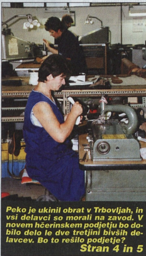
Peko je ukinil obrat v Trbovljah, in vsi delavci so morali na zavod. V novem hčerinskem podjetju bo dobilo delo le dve tretjini bivših delavcev. Bo to rešilo podjetje? Stran 4 in 5