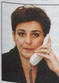
Piše: Lidija Jerkič, univ. dipl. iur.