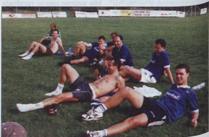
Nogometaši Henkla so zaslužno osvojili drugo mesto.