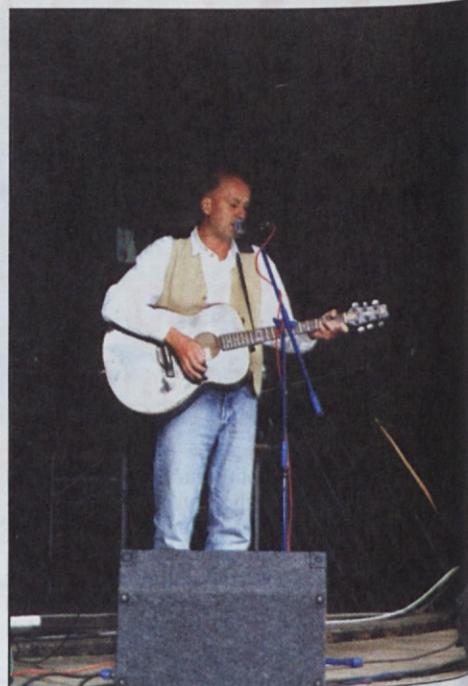
PLT Vlado Kreslin med nastopom.