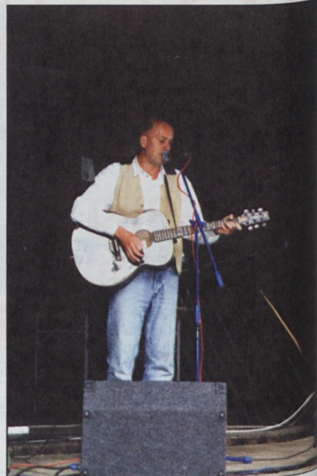
PLT Vlado Kreslin med nastopom.