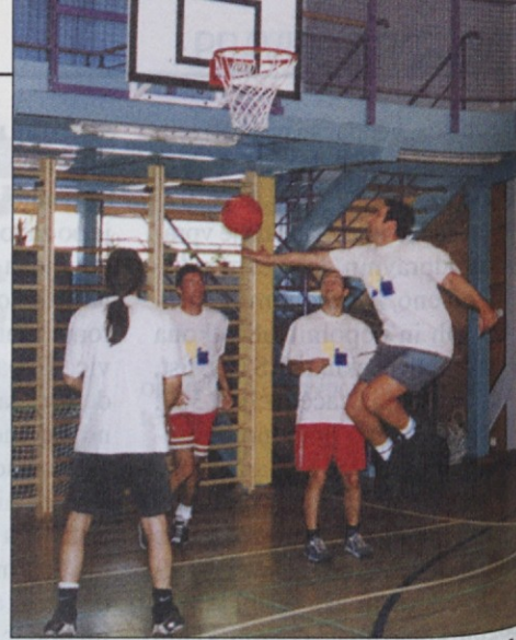
Košarkarji KNG so bili pravi virtuozji.