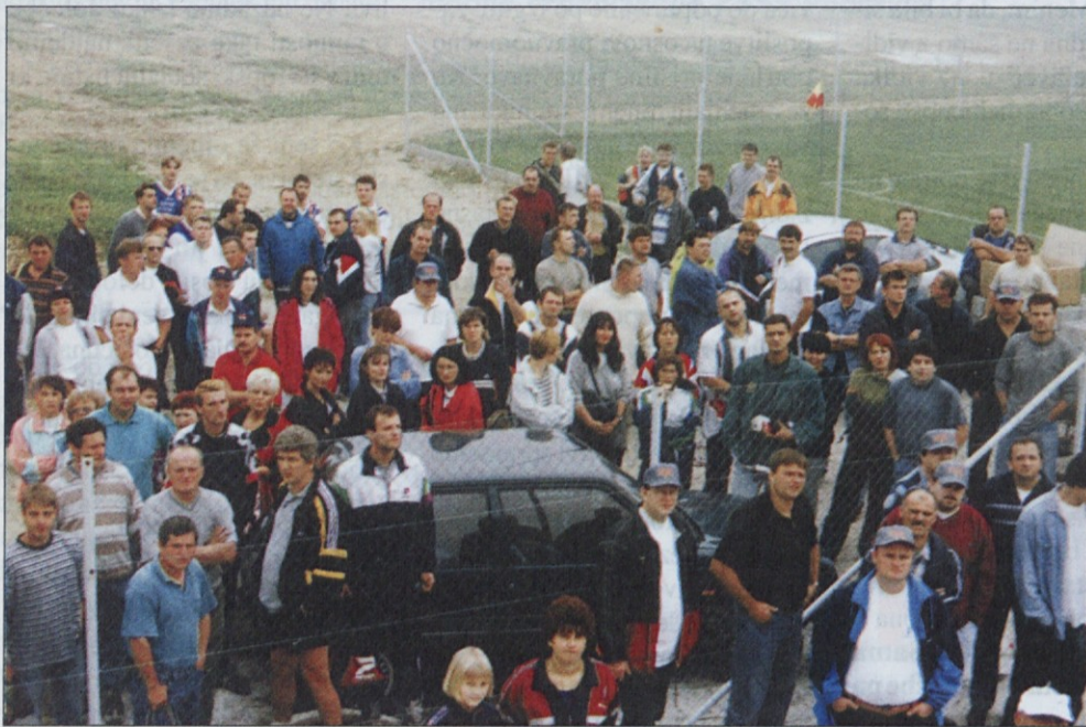
Na srečanju se je zbralo 720 udeležencev iz 28 podjetij.