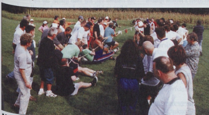
Malce je manjkalo, da KNG-jevci niso strgali vrvi.