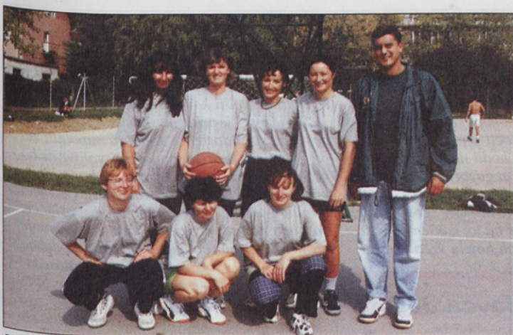
Košarkarice Cinkarne so si za trenerja poiskale postavnega fanta.