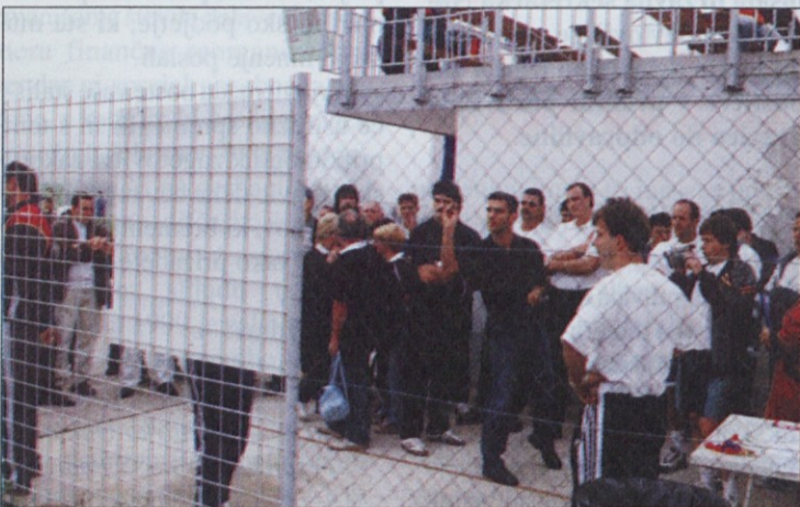
Največja gneča je bila na tekmovanju v pikadu.