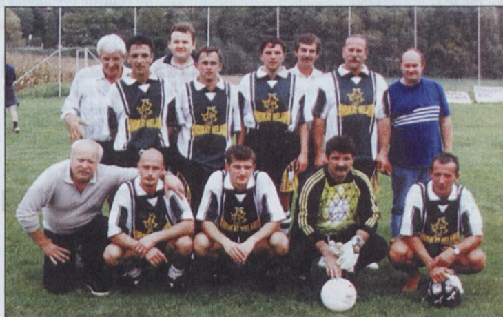
V nogometu - najbolj množični disciplini - je sodelovalo 23 ekip, najboljši so bili iz Melamina Kočevja.