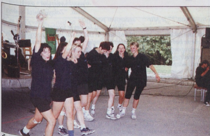
Ženska ekipa Johnson Controls - NTU je z navdušenjem sprejela pokal.