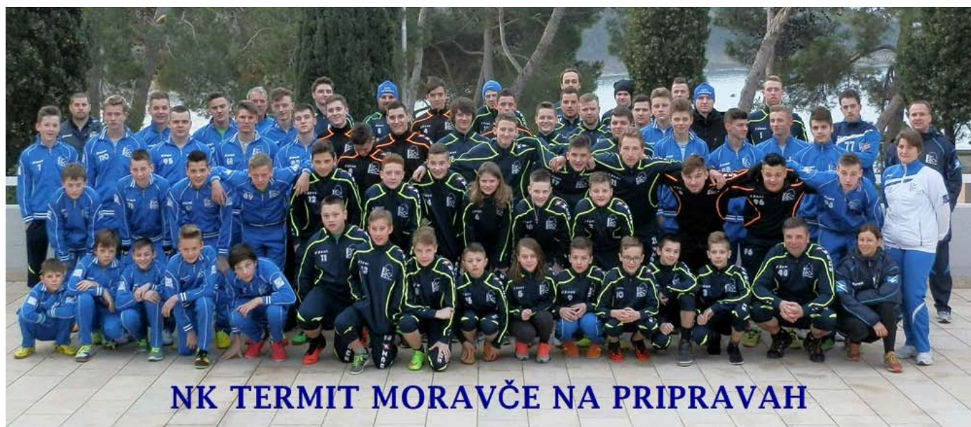
NK TERMIT MORAVČE NA PRIPRAVAH