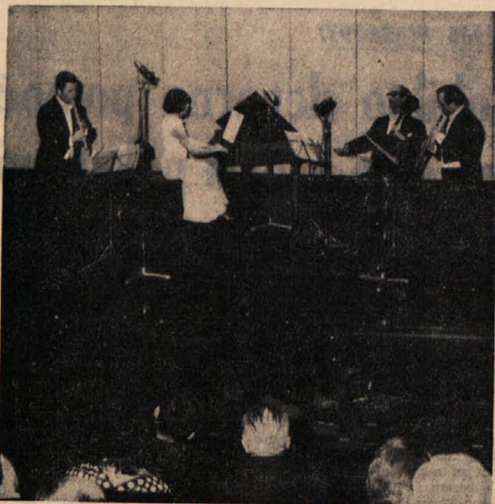
Kakor smo že poročali, je Tržaški baročni ansambel imel v soboto zvečer v veliki dvorani Kulturnega doma lep in uspeh koncert