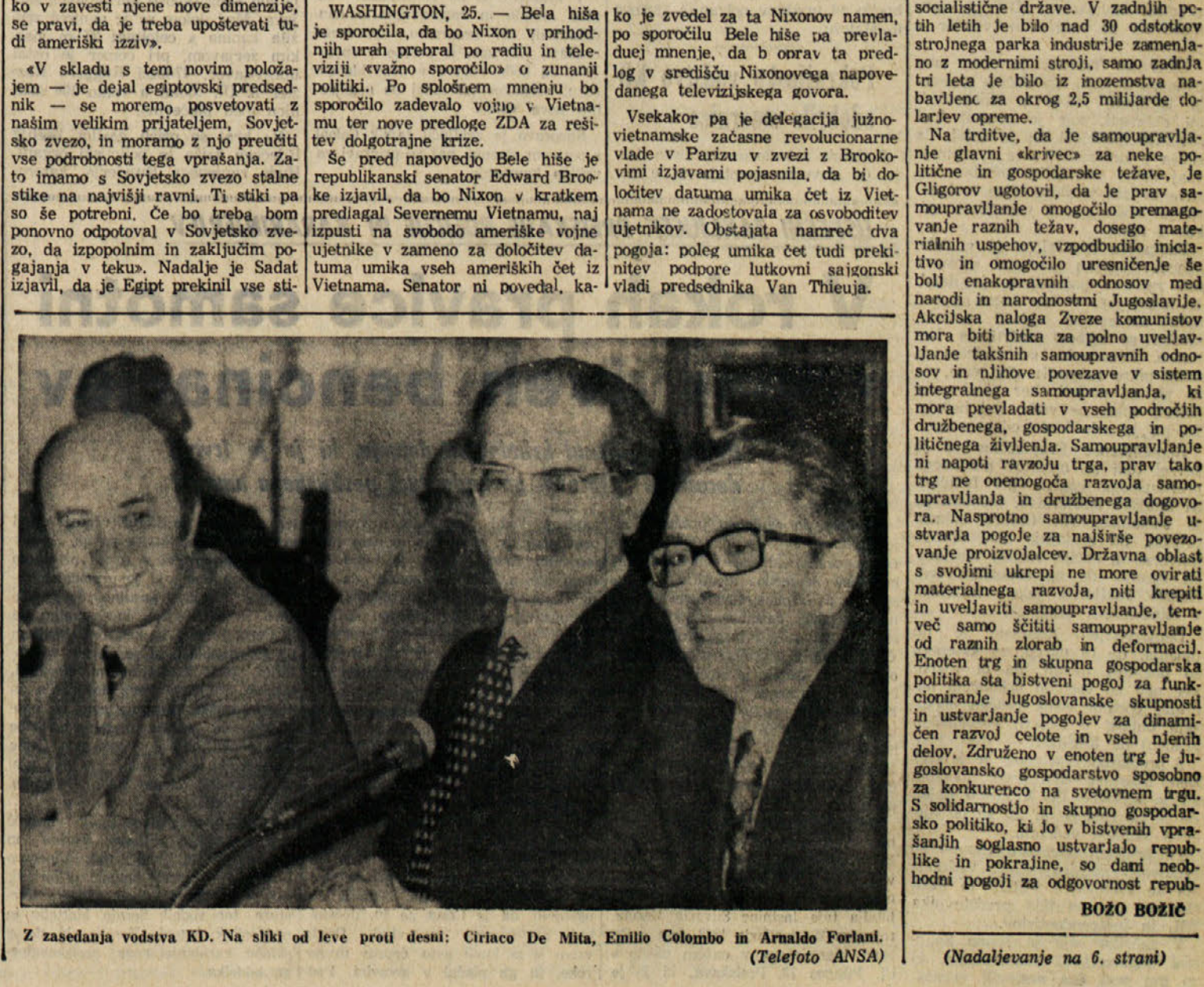
Z zasedanja vodstva KD. Na sliki od leve proti desni: Ciriacio De Mita, Emilio Colombo in Arnaldo Forlani.

RABAT, 25. — Po obisku v Turčiji je pakistanski predsednik Zulfikar Ali Buto prispel danes popoldne na uradni obisk v Maroko.