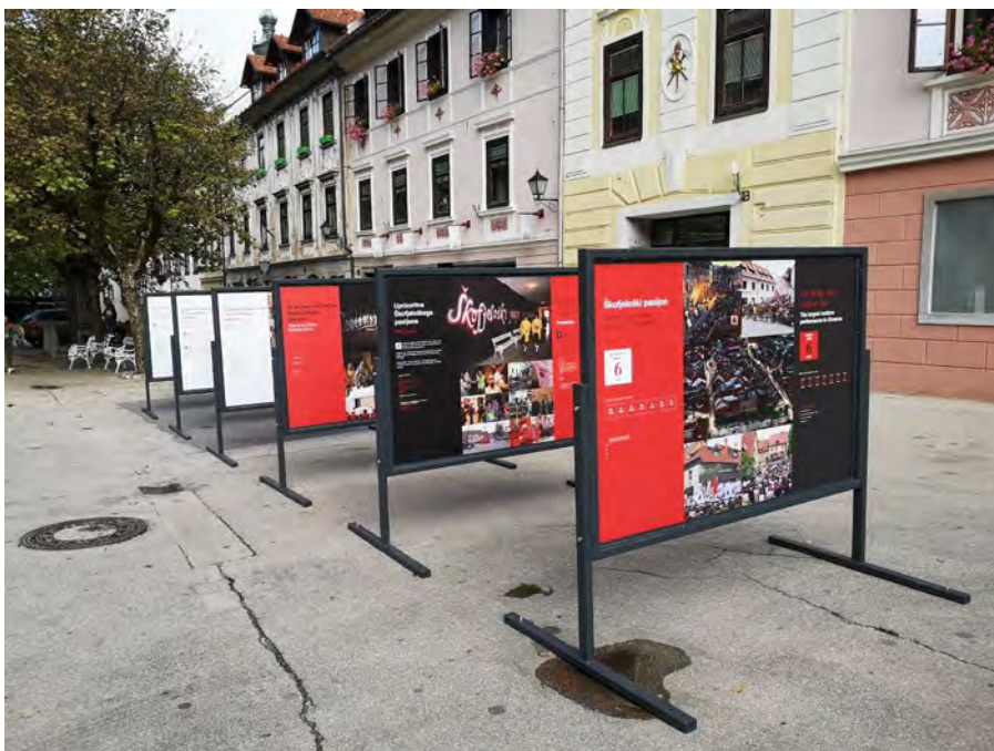
Septembra 2020 je na Mestnem trgu v Škofji Loki zaživela razstava s predstavitvijo pasijona.

Leto 2021, v katerega smo vstopili, je za Škofjo Loko pomembno, saj bomo obeležili 300. obletnico Škofjeloškega pasijona. Letnica 1721 je zapisana na knjigi patra Romualda. 300 let se je v Kapucinski knjižnici ohranila knjiga – prvo dramsko besedilo, ki je bilo zapisano v slovenskem jeziku in 300 let je med ljudmi živela in preživela tudi v težkih časih živa dediščina pasijonske procesije. Njena vsebina je v tem času še kako aktualna in se nam sama od sebe, če si tega želimo ali ne, približuje. Škofjeloški pasijon pa ni pomemben samo za naše mesto in širše loško območje, ampak je tudi del slovenske in svetovne kulturne in duhovne dediščine, saj je bil pred petimi leti vpisan v Unescov Reprezentativni seznam nesnovne kulturne dediščine človeštva. Vpis izpostavlja številne generacije ljudi, ki so s svojim delovanjem skozi tri stoletja skrbele za ohranjanje pasijona.