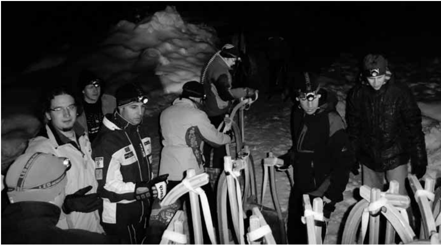
Te so najboljše, te bodo moje!

Zimovanje logaških študentov je že klasika