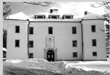
Besedilo in foto: France Brus

O bnova gradu v Gornjem Logatcu, ki jo delno financirata Evropska unija prek programa Naložba v vašo prihodnost Evropskega sklada za regionalni razvoj in Republika Slovenija, lepo napreduje. Vanjo investira logaško podjetje Artcom. V kolikor bo tako napredovala tudi obnova notranjosti gradu, bo Logatec dobil pomemben kulturni in gospodarski objekt, ki bo v ponos kraju in občini.