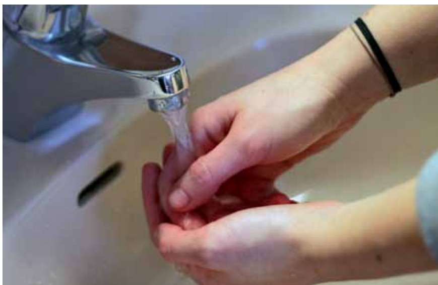
Po novem bodo občani plačevali enako ceno za vodo kot gospodarstvo, kjer je bila do zdaj za okoli 70 odstotkov dražja.

Novo ceno za odvajanje in čiščenje komunalne in padavinske vode se bodo razlikovale glede na to, kam iz gospodinjstva je speljana odpadna voda: v javno kanalizacijo, pretočno oziroma nepretočno greznico ali v malo čistilno napravo. Z omrežnino bo komunalno podjetje pokrilo stroške javne infrastrukture, uporabnikom naj bi jo zaračunavali vsak mesec glede na obračunski vodomer. Postavke v ceni so še drugi stroški izvajanja javne