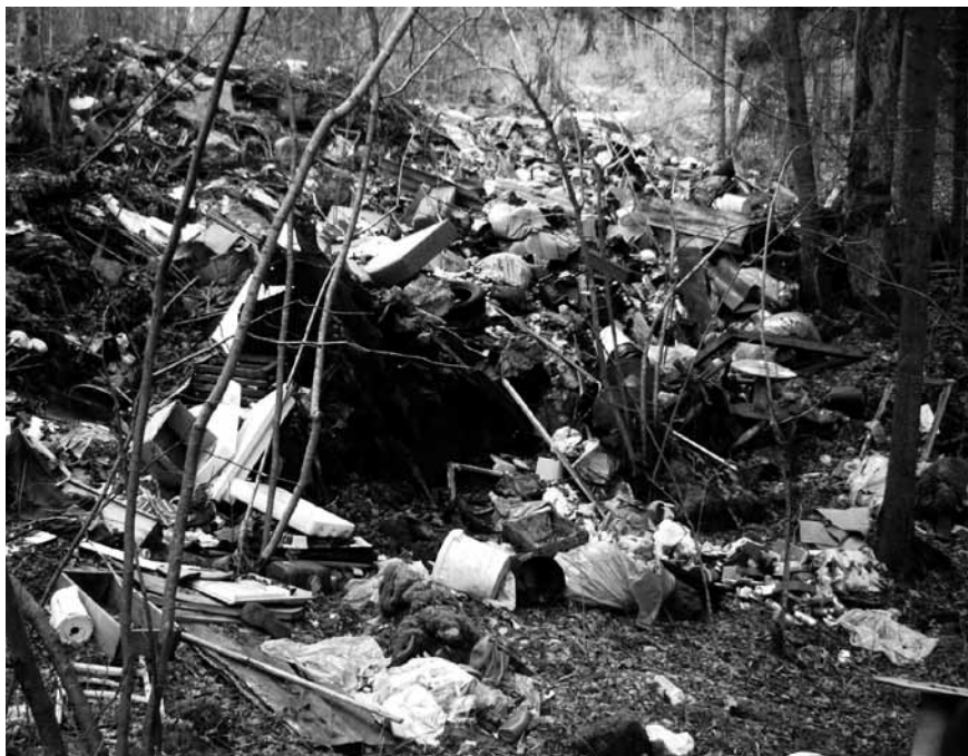
Taka črna odlagališča v naravi (na arhivski fotografiji izpred dveh let odpadki ob priključku na avtocesto) bi radi očistili v akciji Očistimo Slovenijo.