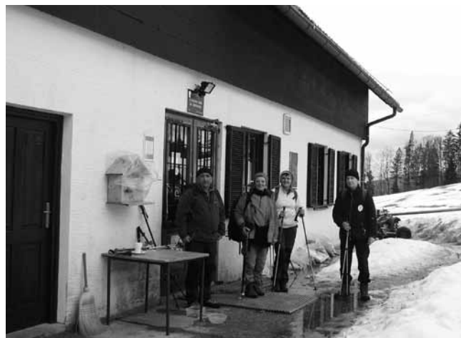
V domu na Šmohorju so se pohodniki okrepčali in se pogreli s čajem.

Po krožni poti smo nato hodili po gozdnih poteh in travnikih, skozi mešani gozd, kjer je veliko kostanja in borovničevja ter vresja, kjer ne manjka vikend hišic in stojijo redke hiše in kmetije. Pri hoji po pobočju nas je oviralo podrto drevje. Pot se je dvigala, snežna odeja pa debelila. Po grebenu, kjer je precej pihalo, smo okrog poldneva dosegli vrh Maliča (936 m), ki je najvišji vrh Šmohorja. Po krajšem počitku smo zaradi vetra ubrali markirano planinsko pot, ki nas je pripeljala do doma na Šmohorju (784 m). Dom stoji tik pod travnatim temenom na vzhodni strani vrha, ki nosi enako ime kot razloženo naselje s cerkvico sv. Mohorja, ki se prvič omenja leta 1421. Od doma in s Šmohorja je precej širok razgled. Na vzhodni strani je bližnji Malič, proti jugovzhodu dolina Savinje z Laškim, naprej pa Veliko Kozje, Lisco in Bohor; na jugu je dolina Rečice z Rečico, nad njo se dviga Šmihel, naprej so Kopitnik, Gore in Kum; na zahodu vidimo Kal, Mrzlico in Gozdnik; na severu je precejšen del Savinjske doline, nad njo gričevnata Ponikevska planota, za