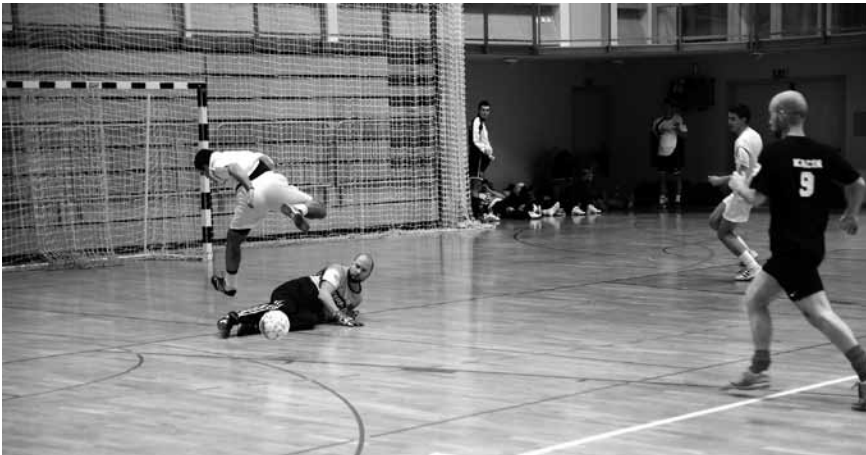
Na ravnini pred ciljem v Hotedršici.

Športno društvo Log-Zaplana je 20. februarja v športni dvorani v Logatcu pripravilo zimski turnir v malem nogometu.