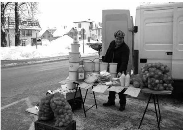
Besedilo in foto: France Brus

Sveti Valentin, ki po starem ljudskem izročilu prinese ključ od skorenin, je 14. februarja, ko je Logatec pokrivala debela snežna odeja, praznoval svoj god. Pred tradicionalnim mesečnim sejmom so se delavci komunale z mehanizacijo in lopatami lotili čiščenja snega na Cankarjevi cesti, da so 12. februarja sejmari lahko postavili svoje stojnice. Stalni prodajalec z Brkinov (na fotografiji) ima redne kupce krompirja, kisle repe in zelja, ki ga logaške gospodinje zelo cenijo. Valentinov sejem je potekal brez dodatnega angloameriškega šarma, ki je v zadnjih letih svojstvene načine izpovedovanja ljubezni prinesel tudi k nam.