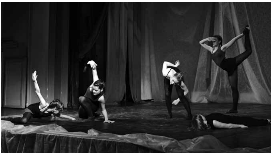
Mlade plesalke so se pokazale na odru Narodnega doma.

Območna izpostava JSKD Logatec je pripravila 8. območno srečanje plesnih skupin – V devetih skupinah se je predstavilo 64 plesalcev