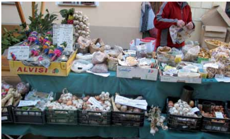
Kot некоč je tudi danes na Gregorjevem sejmu mogoče kupiti nekatera semena in čebulček.

Osrednji semenj pa je bil že iz davnine na gregorjevo, 12. marca, na dan go-