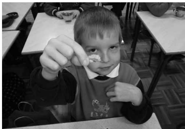
Oreški so veliko bolj zdravi od kinder jajčk ali čipsa.