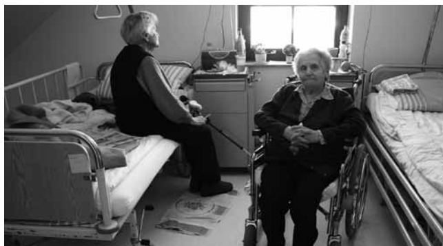
Varovanci doma sv. Jožefa v Gornjem Logatcu že uživajo v novih prostorih v Dolnjem Logatcu.

Za dokončanje projekta bo potreben še 1,5 milijona evrov.