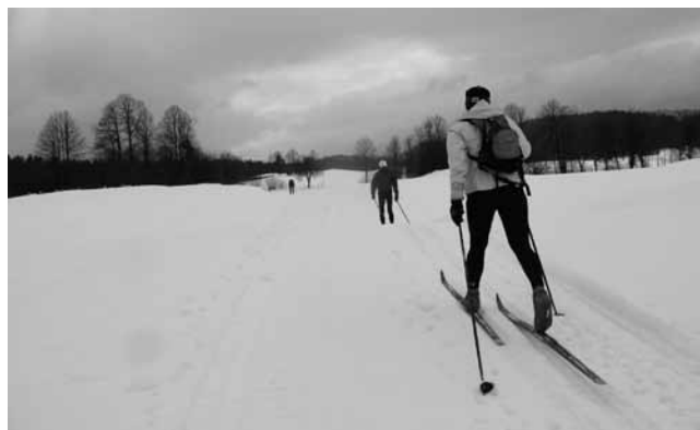
Na ravnini pred ciljem v Hotedršici.

Udeleženci smučarsko tekaške prireditve Po planotah Slovenije so letos na smučeh potovali tudi po območju logaške občine. Prireditev z mednarodno udeležbo je bila tokrat že tretjič, prvič pa so udeleženci spoznavali terene na logaškem območju.