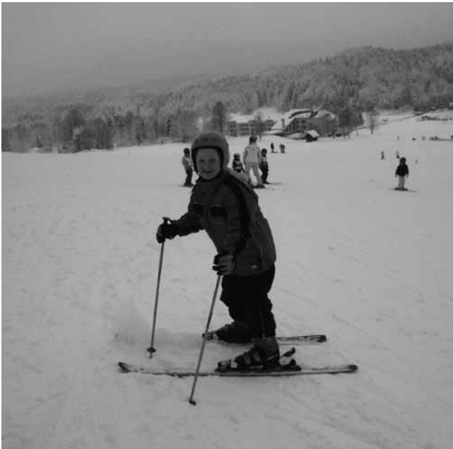
Mladi Rovtarji so uživali na snegu.