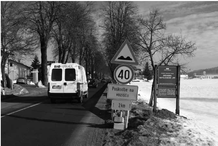
Na občini upajo, da bo direkcija letos počakala s preplastitvijo uničene ceste do križišča pri Valkartonu, saj naj bi jo prihodnje leto začeli celostno obnavljati.

Zavod za kulturno dediščino dal soglasje za posek štirih lip – Sredi drevoreda bodo verjetno uredili križišče in ne krožišče, kot so si sprva želeli na občini