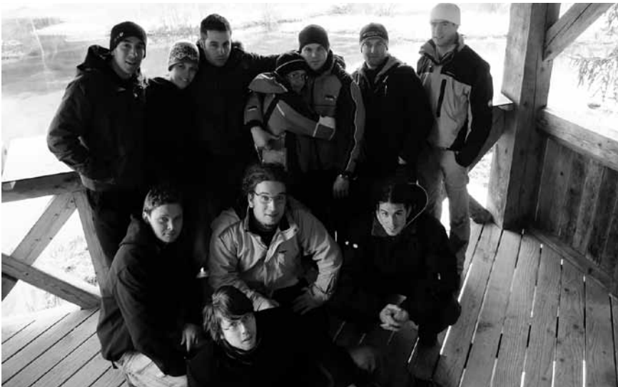
KLŠ aktivisti v Zelencih

V četrtek, 25. februarja, se je v zgodnjih dopoldanskih urah na zimovanje v Kranjsko Goro iz Logatca odpeljal prvi kombi članov logaškega kluba študentov. Utrujeni od izpitnega obdobja smo se veselili tradicionalnega štiridnevnega zimovanja v Kranjski Gori, k dobri volji pa je pripomoglo tudi to, da nas je le-ta pričakala obsijana s soncem.