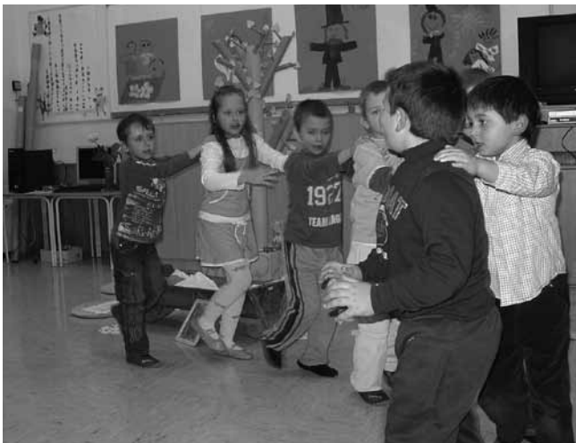
Učenci iz Rovtarskih Žibrš so za kulturni praznik pripravili predstavo.

Se vam zdi samoumevno, da govorimo, beremo, pišemo in ustvarjamo v svojem jeziku? Ljudem, ki so ustvarjali še ne tako davno nazaj, se to ni zdelo niti mogoče, kaj šele samoumevno. Zato je lepo, nujno in prav, da smo Slovenci svoji kulturi podarili praznik. Posvečen je Francetu Prešernu in njegovi besedi. V svojih časih je mislil na nas, na naslednje rodove. In ne zaman, kajti danes smo tukaj. Smo kulturni. In on je z nami, za vedno naš.