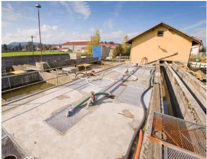
Kanalizacijske vode se bodo na stari čistilni napravi, ki je mnogim trn v peti, čistile še vsaj dve leti.

Za projekt čakamo le še na eno soglasje, nato bomo dali vlogo za gradbeno dovoljenje, upam, da ga bo upravna enota izdala po hitrem postopku. Projekt je sicer zahteven, a večji del območja, zajetega v njem, leži v drugem ali tretjem vodovarstvenem obmo-