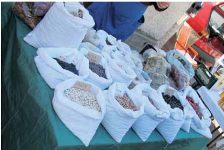
Nekoč je semena, zlasti fižol na sejmu ponujala tudi domačinka De Glerieva mama.

Prodajalci so se razvrščali od nekdanjega stopnišča k prosvetnemu domu (danes dom na Griču) mimo Dolšajrove in Poženelove hiše proti Stari cesti, vse do Konzuma, pritlične stavbe pozneje nadzidanega poslopja današnje kmetijsko-gozdarske zadruga. Med stojnicami so bili tudi prodajalci cajhastih oblačil in metrskega blaga.