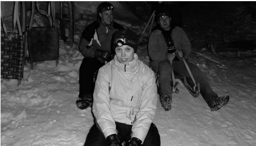
Za startno črto