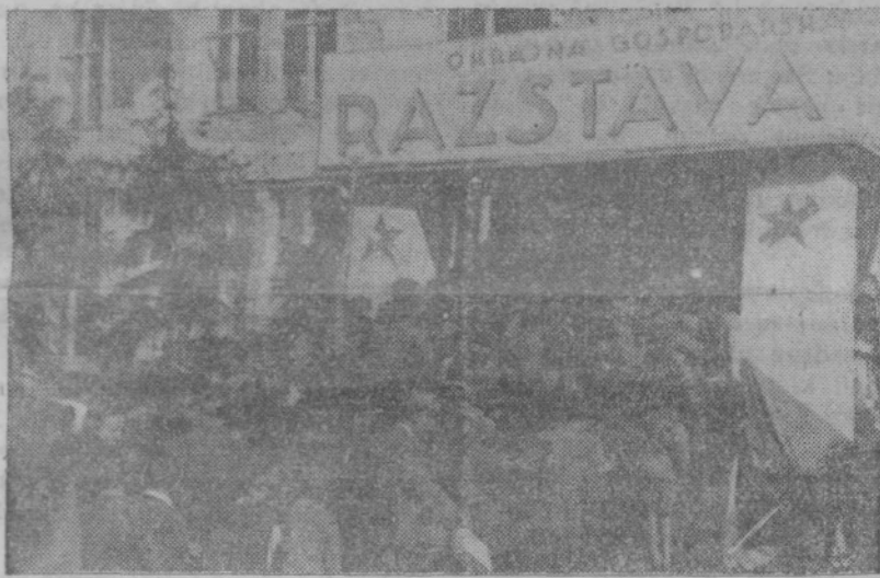
Množično so prišli na razstavo, množično bodo odšli na volišča

Prvi izgledi za uspešno izvedbo volitev zavisijo od aktivnosti frontnih funkcionarjev in članov pri izvajanju navodil okrajnega plenuma OF in pri sodelovanju ter disciplini članov. Nedvomno ne bo nikdo od frontnih funkcionarjev omaloževal demokratičnost predstojilnih volitev, niti važnosti predvolivnih priprav, zato bo takoj pristopil k delu in se tesno povezal z okrajnim odborom OF v Ptuj zaradi stalnega poročanja o stanju priprav in uspehov na terenu. I. F.