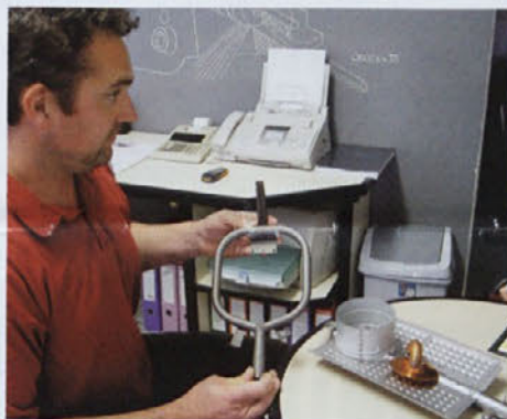
Plinski gorilnik za Gorenje

Ekskluzivna pogodba z Gorenjem za podjetje Kev predstavlja približno 100 milijonov letnega prometa, a to je šele 20 odstotkov letne realizacije. In tudi serijska proizvodnja, kamor spada posel z Gorenjem, pa Schiedlom, pa Mariborsko livarno in še kom, je le polovica nji-