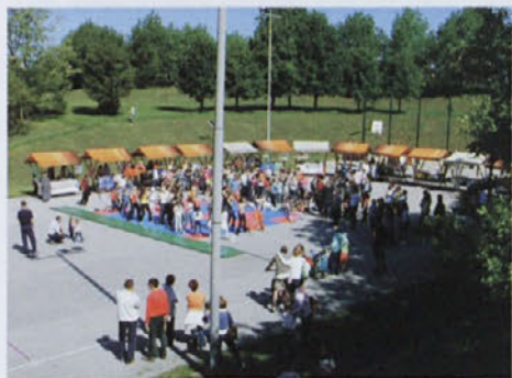
Na sejmu je sodelovalo 350 različnih skupin

Gimnazija Ormož je k sodelovanju povabila številna društva, klube in zavode. Mnogi so se odzvali, tako da je bilo na sejmu okoli 350