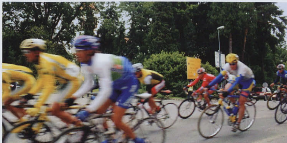
Leteči cilj v Ormožu