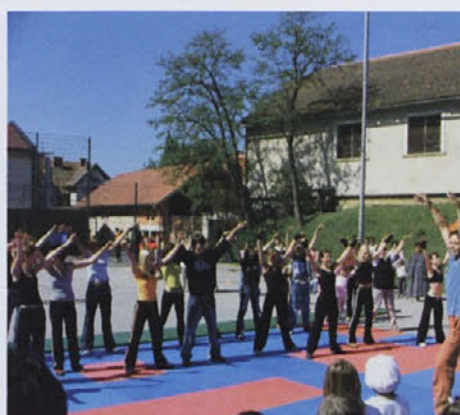
Zdrav duh v zdravem telesu

Za prijetno vzdušje so poskrbeli tudi nastopajoči: Aerobika, akrobatska skupina OŠ Tomaž, različne baletne skupine, B.B.T., Hip hop