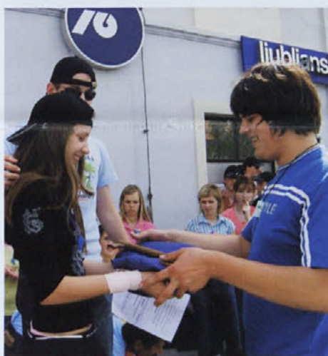
Ključ so si prislužili dijaki 3. a razreda