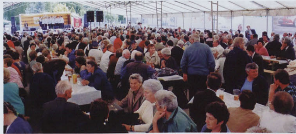
Srečanja upokojevcev ormoške občine so se udeležili tudi varovanci doma, foto Hozyan

Leta 1998 je bila v Ormožu z namenom, da bi se na enem mestu izvajalo čim več aktivnosti za starejšo populacijo, ustanovljena zasebna družba s koncesijo. Prav zaradi tega so družbo, katere večinski lastnik je Občina Ormož, poimenovali Center za starejše občane.