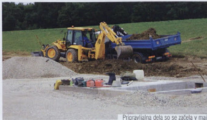
Pripravljala dela so se začela v maju