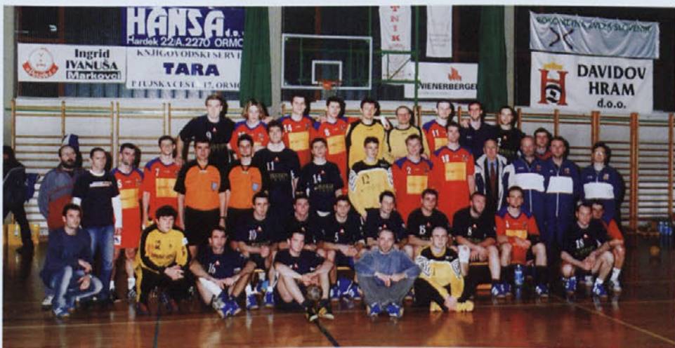
Naša rokometna ekipa z ekipo reprezentance Česke