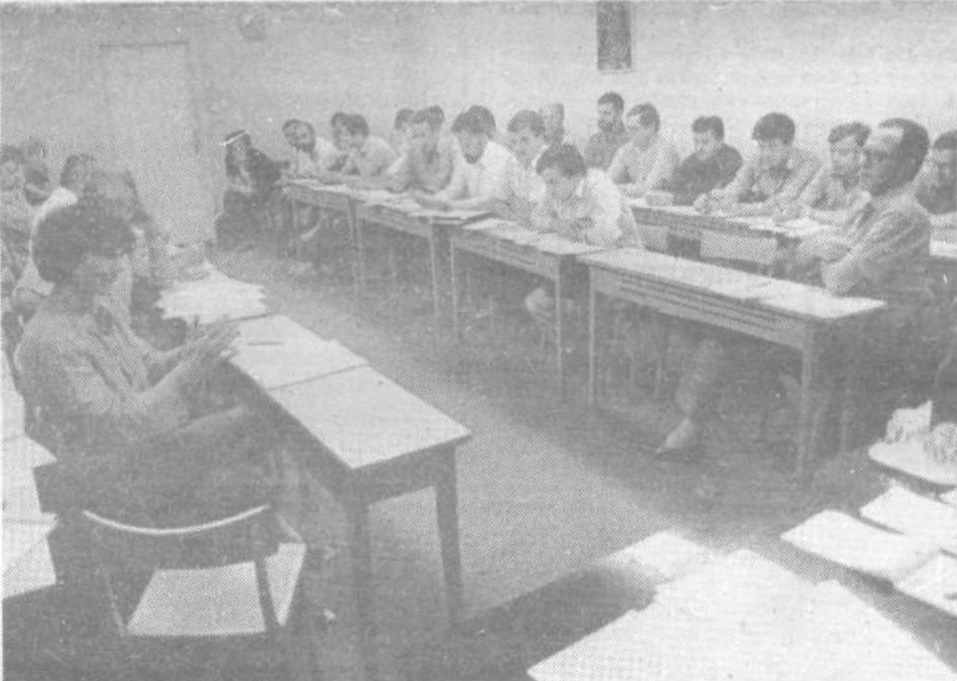
Seja občinskega komiteja ZKS, katere osrednja razprava je bila namenjena aktivnostim in pripravam na razpravo po 13. seji CK ZKS — na njej so sprejeli vrsto usmeritev in konkretnih zadalžitev — se je udeležil tudi predsednik CK ZKS Andrej Marinc. Nekoliko širši zapis bomo objavili v naslednji številki glasila.

Pri vsem tem se moramo seveda zavedati so poudarili na posvetih, da teh ocen ne sprejemamo zaradi ocenjevanja, saj imamo tega že več kot dovolj. »Tokrat moramo biti zares kritični in samokritični ne pa kritizerski-objektivni in plodni v smislu smernic za nadaljnje delo.« so sklenili sekretarji osnovnih organizacij.