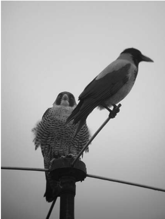
Slika 2: Sokol selec Falco peregrinus in siva vrana Corvus corone cornix , opažena v južnem delu Ljubljane

Poleg sokola selca sem v Ljubljani zbral še 7 opazovanj kragulja. Ljubljani najbližje kraguljevo gnezdišče leži na severnem delu Ljubljanskega barja (TOME et al. 2005). Večinoma sem kragulja opazil med letom, dvakrat sem videl, kako je med sedenjem prežal na morebitni plen. V nasprotju s sokolom selcem, ki je čepel skoraj izključno na antenah, je kragulj čepel na robu strehe stolpnice ter na reklamnem panoju Ilirije.