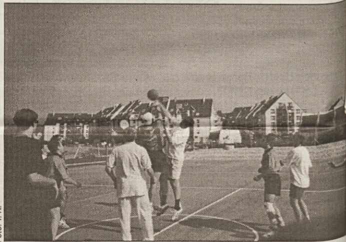
Košarkarji so v sončnem vremenu zaigrali kar na odprtem igrišču.