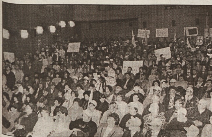
DOBIMO SE 24. SEPTEMBRA NA TRGU REPUBLIKE V LJUBLJANI