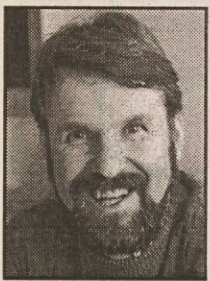
Piše: Rajko Lesjak