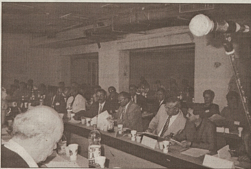
KAKO NAPREJ? – Razmišljanja o tem so bila rdeča nit 1. poveljnega kongresa sindikata PPDIVUT Bosne.

Na povabilo Mehmeta Avdagića, predsednika PPDIVUT, sem se v Sarajevu udeležil 1. poveljnega kongresa Sindikata kmetij-