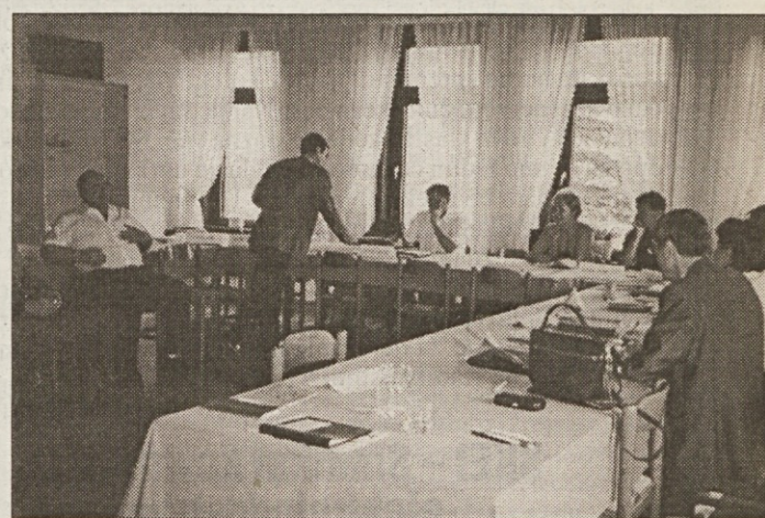
Pravni zastopnik delodajalcev izroča predsedniku arbitraže nove dokaze.

V podjetjih se spleča sklepati sporazume o zagotavljanju zaposlitve, ki lahko vsebuje tudi