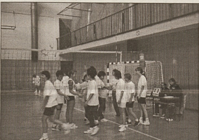
V ženski odbojki so se pomerile tudi zdravstvene delavke iz Nove Gorice in Metlike, ki pa jim športna sreča tokrat ni bila najbolj naklonjena. Na koncu so morale priznati premoč Štajerkam.

Maribor, 2. Zdravstveni dom dr. A. Drolca Maribor, 3. SZV Dutovlje; moški: 1. Zdravstveni dom dr. A. Drolca Maribor, 2. Splošna bolnišnica Maribor, 3. Zavod dr. M. Borštnarja Dornava; odbojka – ženske: 1. Splošna bolnišnica Maribor, 2.