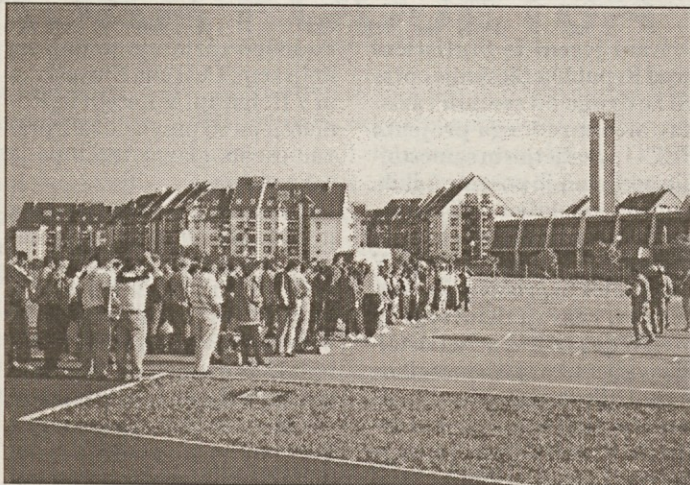
Na 4. športnih igrah Sindikata zdravstva in socialnega skrbstva se je letos zbralo preko 360 udeležencev iz 16 zavodov.

Po svečani otvoritvi so se zdravstvene delavke in delavci pomerili v številnih športnih disciplinah. Tako kakor na do-