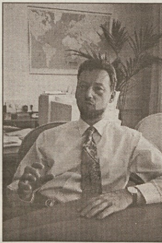
Leta 1992 je Danfoss kupil propadajočo Gorenjevo tovarno kompresorjev in jo razvil v eno svojih najpomembnejših proizvodjalnih gospodinjske aparate. Vanjo je doslej vložil 85 milijonov mark, delo pa je v njej našlo 630 ljudi, od tega letos v novi tovarni 330.

Samostojno podjetništvo v Sloveniji dobro razvito