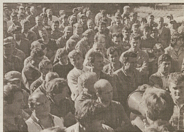
Takole so delavci Litostroja lani septembra protestirali pred svojo upravno stavbo.

dstvo koncerna račun brez krčmarja, pravijo sindikalni zaupniki. Ker zaposlenim ne dajo niti osnovnih informacij, se je izjalovil tudi sklic zbora malih delničarjev, ki ga je sklical eden od direktorjev. Ljudem niso povedali, kaj bo z njihovimi delnicami, vsiljevali pa so jim, naj glasujejo za povezavo s strateškim partnerjem iz Švice. Veliko zaposlenih v koncernu hrani tudi svoje certifikate, saj jim je bilo obljubljeno, da bodo zanje dobili Litostroj delnice. Računali so tudi, da bodo dobili tudi delnice za premalo izplačane plače. Zdaj lahko ostanemo brez vsega, kako naj se s tem strinjamo, protestirajo sindikalni zaupniki.