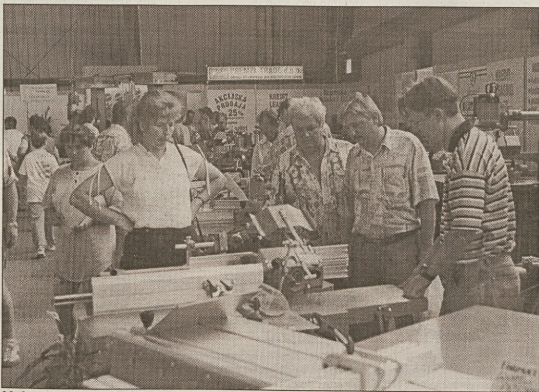
Mednarodni sejem malega gospodarstva je prav gotovo največja sejmska prireditev v Sloveniji in druga največja tovrstna v Evropi. Odbor za gospodarstvo državnega zbora je posvetil eno sejo malemu gospodarstvu in se sklenil zavzeti za večjo državno podporo in zaščito tega pomembnega dela gospodarstva.

Mednarodni obrtni sejem v Celju ni pomemben le zaradi mogočih navezav poslovnih stikov. Veljavo mu dajejo številne strokovne prireditve, med katerimi je najodmevnejše tradicionalno posvetovanje o položaju obrti na Slovenskem z obvezno udeležbo