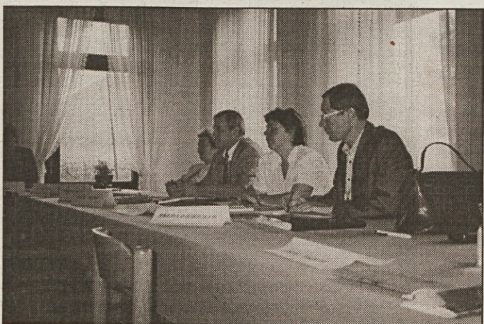
Delojemalci se bodo morali še učiti!