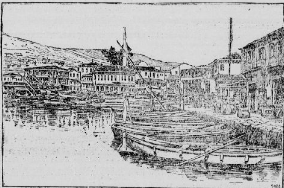
Pristanišče v Kavali.

Po tako dokončani preiskavi se je naslednjega dne izvršila na Rtneku sodba.