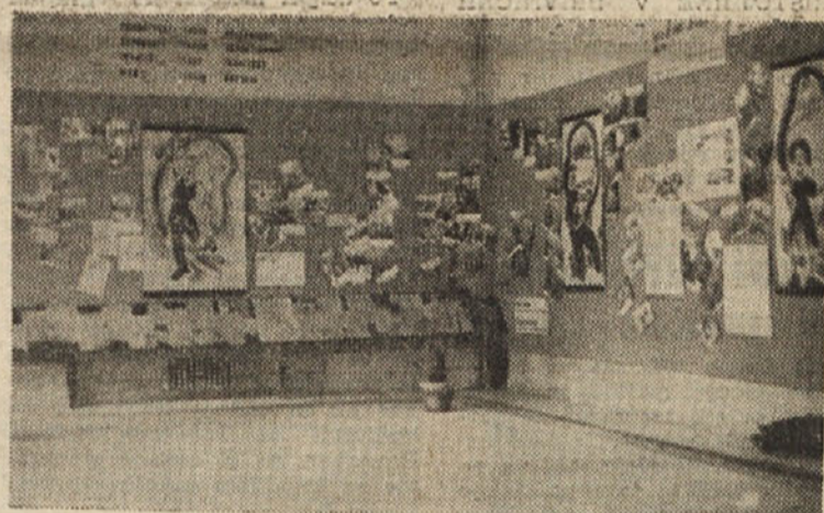
Mladinska razstava pri Enotnih sindikatih

Prav ta borba je znova utemeljevala tudi postulate, ki jih je postavil izvršni odbor Komunistične mladinske zveze v svojem programu za sporazum s socialistično mladino, ki naj postane prvi temeljni kamen za