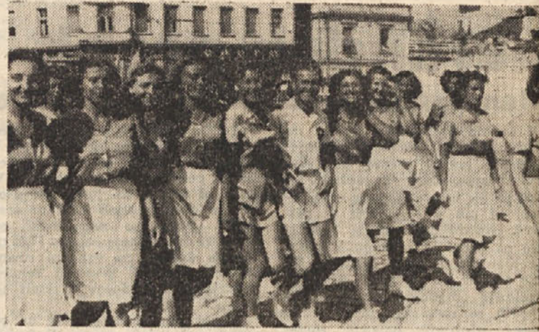
Tržaške mladinske v Beogradu

To bi bilo v kratkem nekaj misli o plavalnem športu na splošno in o treningu. Seveda je naloga trenerja, da preštudira posameznega plavalca in nato določi individualni trening, kajti le tako bodo plavalci dosegli dobre uspehe.