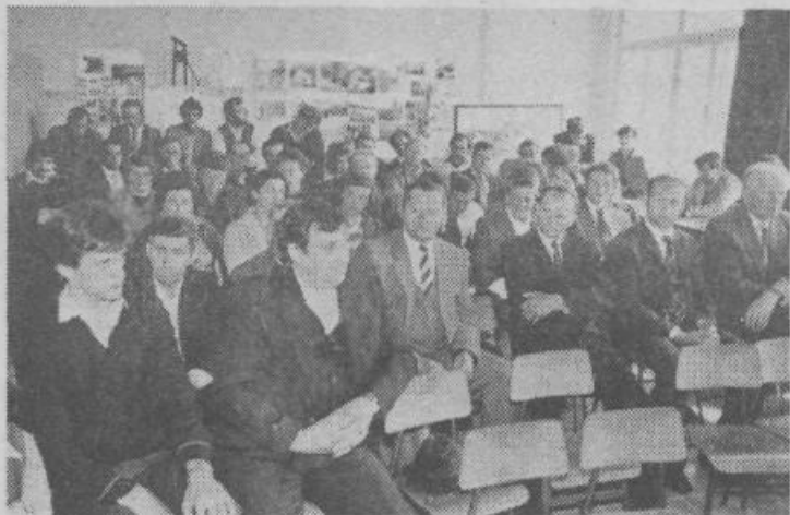
Krajanji so z zanimanjem sledili razpravi

Makor: Sredstva krajevnega samoprispevka smo namenili tudi asfaltiranju cest v KS, seveda ob pomoči komunalne skupnosti. Kdaj je v načrtu asfaltiranje ceste Breg - Radohova vas?