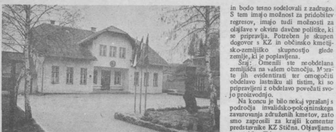
Podružnična šola v Temenici, ki jo to šolsko leto obiskuje 34 otrok