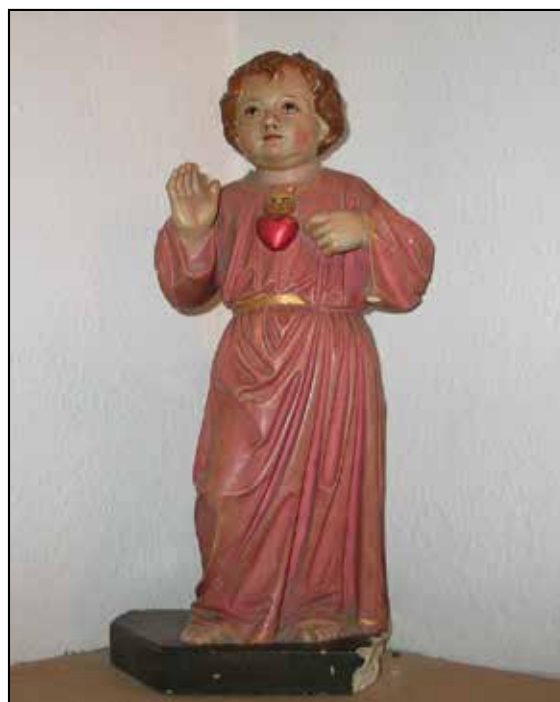
Kip Jezuščka, delo J. Grošlja. Last družine Bešter, Selca 89.