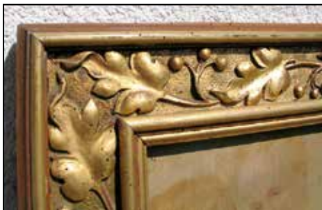
Detajl okvirja za sliko Srca Jezusovega, odličen lesorez s pozlato, delo J. Grošlja. Last družine Leben, Selca 96.