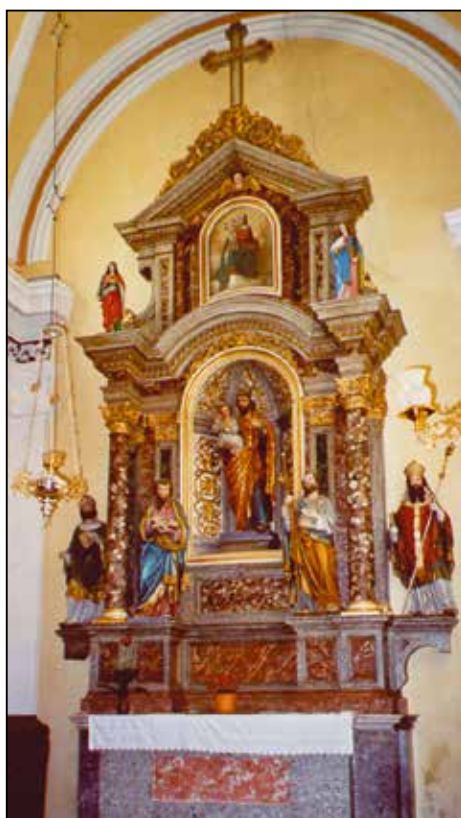
Stranski oltar sv. Jožefa v župnijski cerkvi sv. Petra v Selcih, delo J. Grošlja.