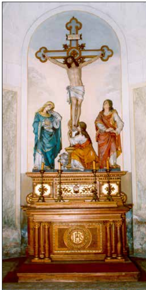
Oltar v pokopališki kapeli v Selcih – delo J. Grošlja.