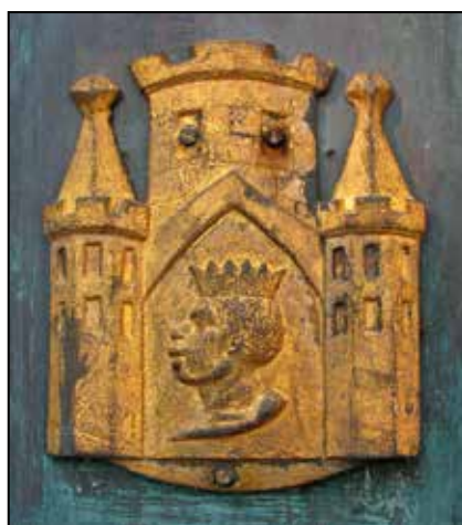
Loški grb na podstavku kipa Janeza Nepomuka na Kapucinskem mostu v Škofji Loki.