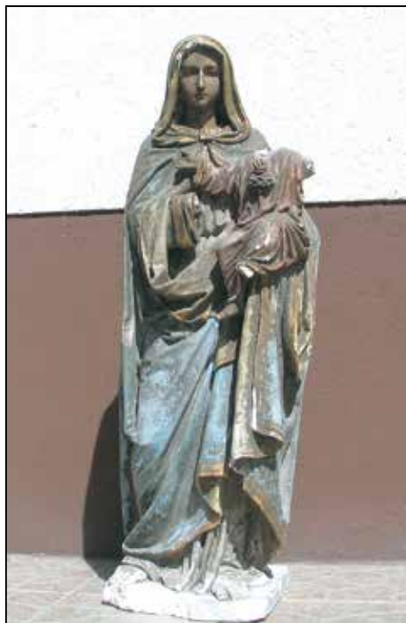
Kip Marije z Jezusom (poškodovan), delo J. Grošlja. Last družine Leben, Selca 96.