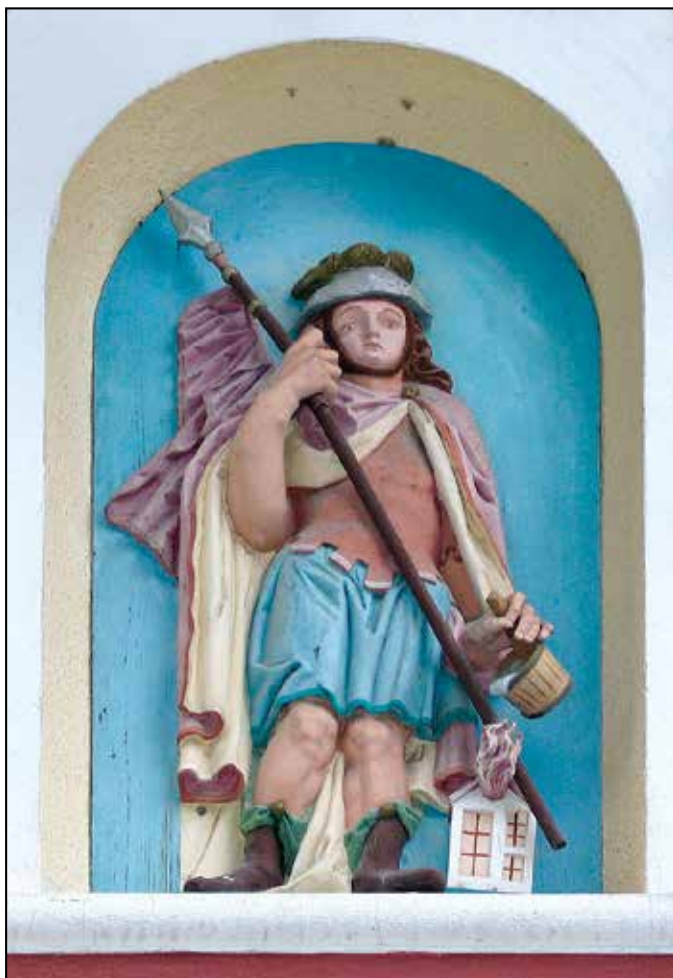
Sv. Florijan – odličen lesorez, ki ga je J. Grošelj izdelal leta 1938 za novi gasilski dom v Železnikih na Racovniku. To je bilo zadnje Grošljevo delo. Foto: Anton Sedej