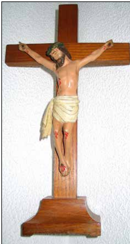
Križ – lesorez, delo J. Grošlja. Last družine Leben, Selca 96.