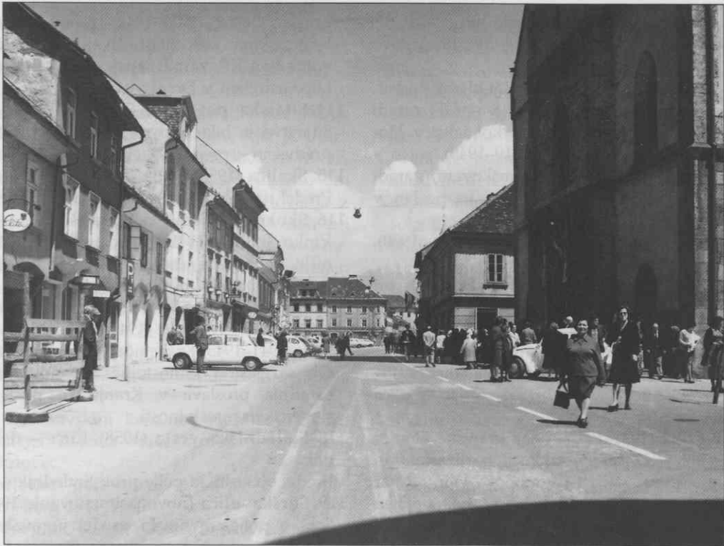
Glavni trg v Kranju se je do leta 1941 imenoval Mestni trg, v času nemške zasedbe Hitlerplatz, od 1945 do 1993 Titov trg