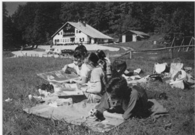
Mladi so v lepem sončnem dnevu odkrivali številne in zelo zanimive motive planinskega sveta pod Snežnikom.