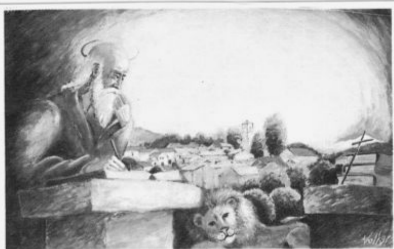
STRIDON 347 ~ SV. HIERONIM ~ STAROD 1997