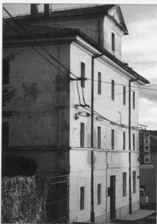
Če bo ustanovljena nova občina, bo imela svoje prostore v Podgradu št. 17.

jevnih skupnosti. Glede na število prebivalcev (po popisu iz leta 1991 je v Podgradu živelo 613, v Podbežah 126, v Račicah 146, v Hrušici 248 prebivalcev) naj bi v petletnem obdobju v Podgradu zbrali 17, v Podbežah in Račicah po 3, v Hrušici pa 15 milijonov tolarjev.