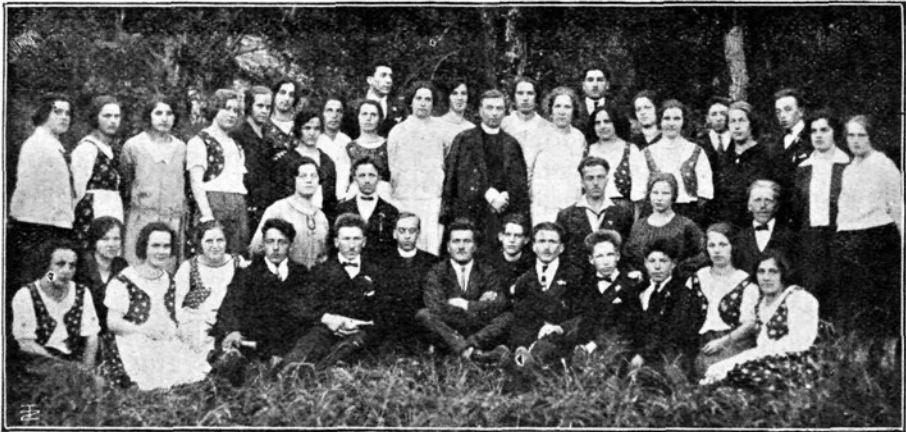
Prosv. društvo v Poljubinu o priliki prosv. tekem.