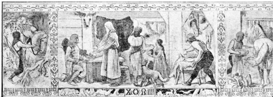
Gostoljubnost naših pradedov.

Misionarji so hodili kar z vojsko. Premagane so poučevali v veri od 7—40 dni, nato so jih prvo nedeljo krstili na ta način, da so jih med krščenjem potapljali v vodo. Tako hitro in prisiljeno izpreobrnjenje pač ni moglo pognati korenin. Zato so cerkveni zbori določili, naj se povsod skrbi predvsem, da bodo krščeni v veri dobro poučeni, ker bi sicer samo oblivanje z vodo kaj malo pomagalo. Pouk naj bode mil in prizanesljiv, zato naj se oznanjuje paganom evangelij ljubezni in ne meča. Ni čudnega, če so se dedje uprli duhovnikom in jih večkrat pomorili, kot toži patriarh Pavlin v pismu na Karla Velikega.