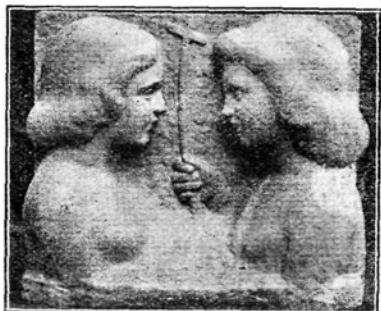
Kristus in sv. Janez.

prišel za vse narode, ki sede v tminah in sencah nevednosti in malikovanja, ne pa samo za judovsko ljudstvo in njegov zunanji sijaj, kakor so zmotno učili farizeji.