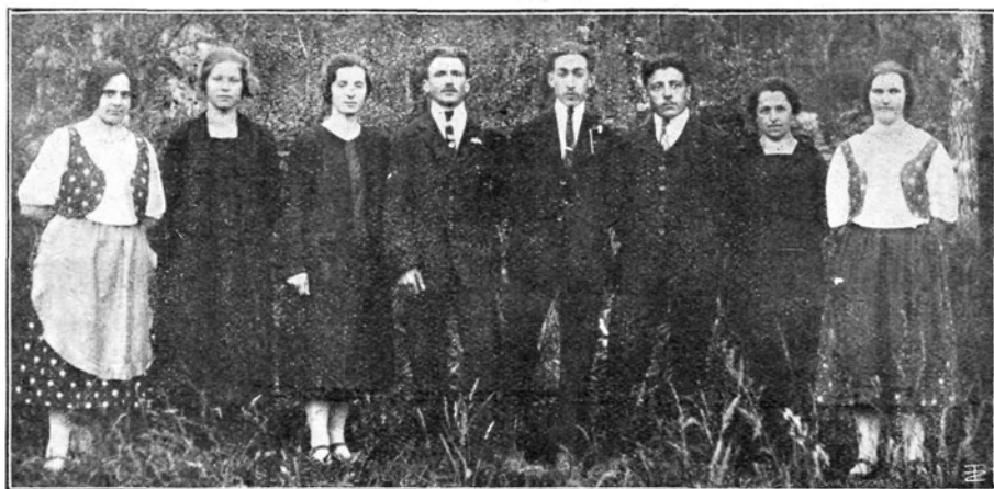
Zmagalci in zmagalke pri prosv. tekmah v tolminskem okrožju.

ljive uspehe. Najboljše moči so na delu. Res, da se zdi to delo težavno, a uspehi kronajo trud.