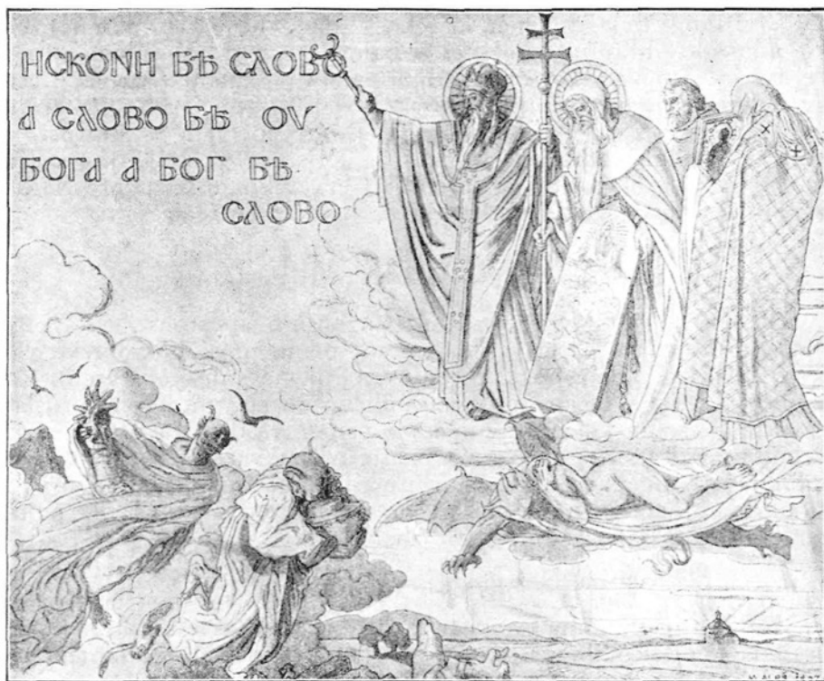
Sveta blagovestnika na Moravskem.

Car Mihael je velel takoj poklicati sv. brata Cirila in Metoda, ki sta umela slovanski jezik. Sprejela sta ponudbo in se začela pripravljati na pot. Konstantin je sestavil še pred odhodom slovanske pismenke, nazvane glagolica. Prestavil je v slovanski jezik nedeljska berila in evangelije ter jih vzel s seboj na Moravsko. Za književni jezik je sprejel narečje, ki so ga govorili v okolici Soluna in mu je