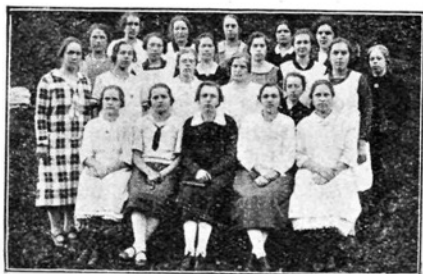
Dekl. krožek v Kanomlji.