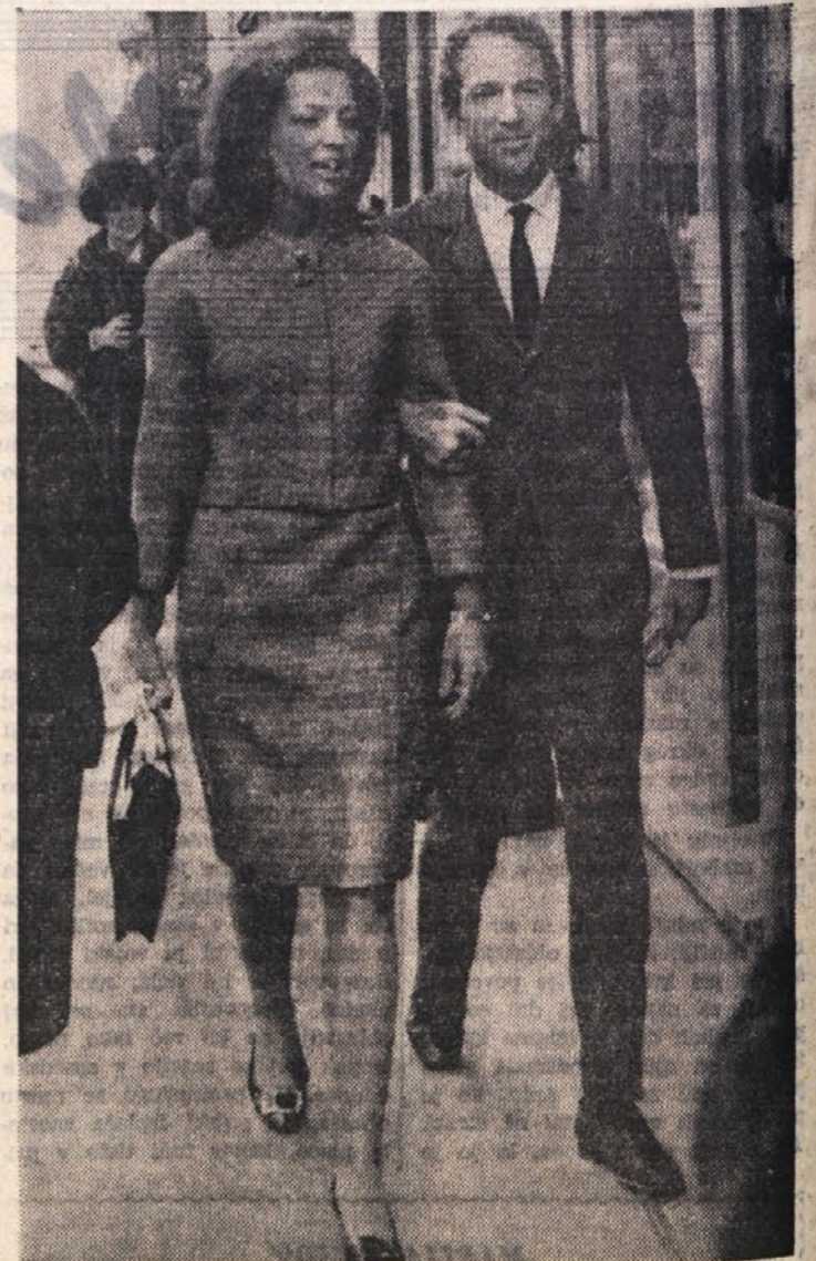
Tudi princeznja Ira Fuerstenberg se je predala filmu. Tu jo vidimo na sprehodu po Rimu

umivali. Enako je bilo tudi v avstrijskih deželah. Sele potem, ko je cerkev pustila v svojem zmotnem stališču glede umivanja, se je polagoma jelo opazati, da polagoma ljudje vedno več važnosti na telesno čistoto. Vendar pa je največji korak napravilo v Evropi šele 19. stoletje. A najbolj viden propeh opažamo pravzaprav sele po drugi svetovni vojni. Saj imamo sami priložnost videti, da v hišah, sezidanih pred vojno, nimajo vsa stanovanja kopalnic. Ne najrazkošnejša so si tak «klusus» mogla privoščiti. Medtem ko sedaj menda sploh ne zidajo nobenega stanovanja brez kopalnice. To je tako nujna «priliktina» sodobnega stanovanja, kot kuhinja, peč ali okno. Se tako skromno stanovanje ima kopalnico, čeprav je samo prha.