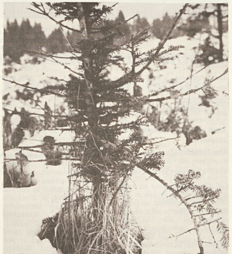
Kjer se zadržuje divjad se jelka težko obdrži. Značilna oblika jelke, ki jo leto za letom objeda jelenjad.