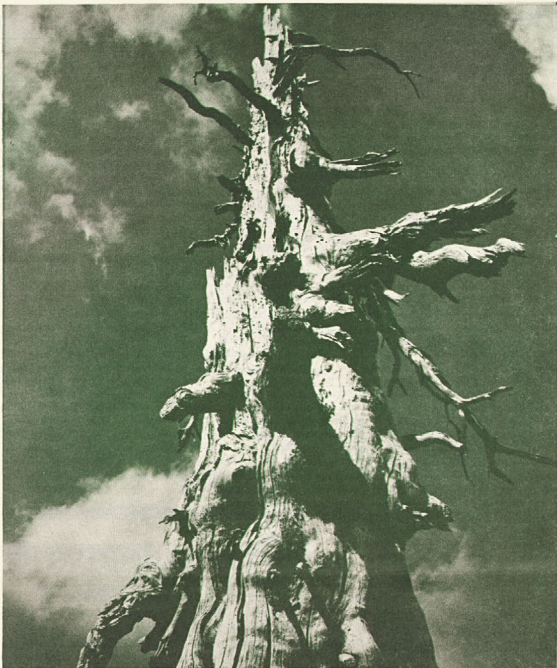
Bil je mogočen vihar . . .

V gospodarstvu je znašal lanski novembrski osebni čisti dohodek na delavca 6840 din, v negospodarstvu pa 9005 din.