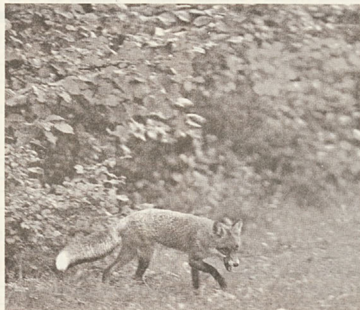
Med najnevarnejšimi prenašalci stekline je lisica.

Z raziskavami v borovih kulturah ruske tajge so ugotovili, da se v vsakem starostnem obdobju razvije značilna skupina gliv, ki imajo bistven vpliv na uspešnost osnovanih nasadov.