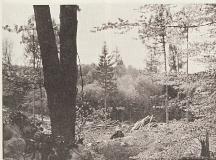
Pred premeno na Brezovi rebri.

Rak kostanjeve skorje uničuje domači kostanj tudi na Japonskem. Tam so ugotovili, da pospešena rast, ki jo dosežejo z gnojili NPK, pospešuje tudi tvorbo kalusa, ki kmalu povsem prekrije okuženo rano.