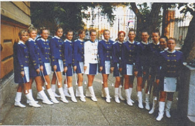
Nasmejane mažorete po uspešnem nastopu v Zagrebu.

G asilska zveza Trebnje vsako leto organizira občinsko gasilsko tekmovanje. Na teh tekmovanjih se na podlagi najboljših rezultatov dobi ekipe, ki se vsako drugo leto udeležijo regijskega gasilskega tekmovanja. Tako je bilo tudi letos organizirano izbirno regijsko tekmovanje, katerega organizator sta bila Gasilska zveza Metlika in regijsko poveljstvo Dolenjske in Bele krajine. Tega tekmovanja se je 18. septembra iz naše zveze udeležilo 10 ekip iz PGD: Trebnje, Občine, Ševnica, Velika Strmica, Štatenberk. Na tekmovanju je sodelovalo 54 ekip pionirjev, mladincev, članic in članov iz gasilskih društev dolenjsko-belokranjske regije. Naša društva so se maksimalno potrudila in dosegla zelo lepe rezultate. Med njimi pa velja izpostaviti PGD Štatenberk, katerega vitrine so bogatejše kar za tri pokale s tega tekmovanja. To društvo je bilo uspešno že na občinskem gasilskem tekmovanju, tako da so se regijskega tekmovanja udeležile kar štiri ekipe in tri od njih dosegle tudi prva tri mesta: ekipa pionirjev prvo mesto, ekipa pionirk in mladincev pa drugi mesti. Ker smo na začetku omenili, da je bilo to izbirno tekmovanje, pomeni, da bodo vse tri ekipe leta 2000 udeležinke državnega gasilskega tekmovanja. Vsem ekipam, ki so sodelovale na tem tekmovanju, iskrene čestitke, kandidatom za državno tekmovanje pa mnogo uspešnih priprav in tekmovalne sreče.