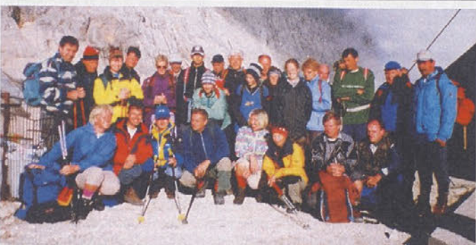
Gasilski posnetek na Kredarici po vzponu na Triglav.