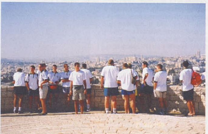
Ekipa RK Trebnje v Izraelu pri ogledu mesta; v ozadju Jeruzalem.

Z uvrstitvijo med šestnajst v Evropi smo si nakopali še dodatne težave. Te so predvsem finančnega značaja, saj smo si morali že za pot v Izrael denar sponositi. Močno upamo, da bodo dobri rezultati pritegnili še kakšnega dodatnega sponzorja.