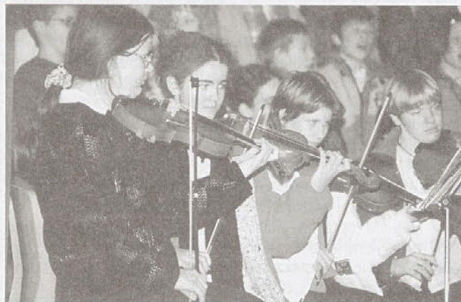
Utrinek z nastopa učencev GS Trebnje v KS Šentrupert.