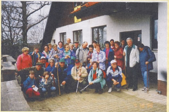
Četrti pohod na Bohor