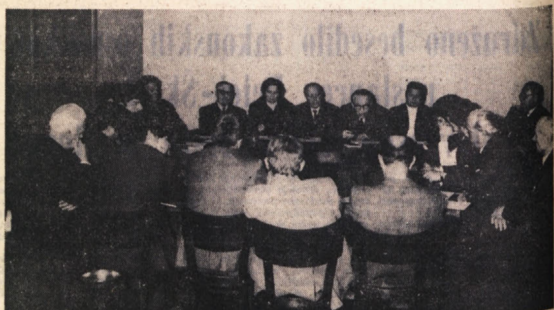
Nekega slikarja s kulturno-prosvetnih prireditelj v prejšnjem tednu: na gornji sliki vidimo odbornike mestnih slovenskih prosvetnih društev...