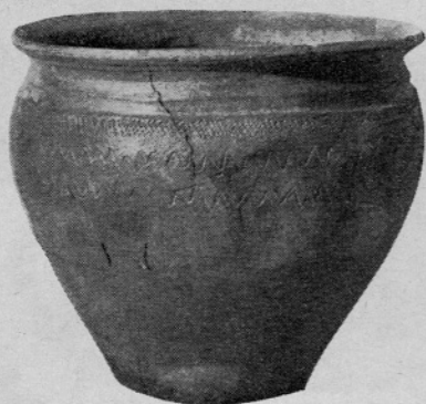
Sl. 5. Lonec mlajše plasti

Že v tej starejši stavbni dobi je prišlo do zanimive preureditve prostora ob jezercu, zvanem od davna Libušino. 23 Gre za izkoriščanje