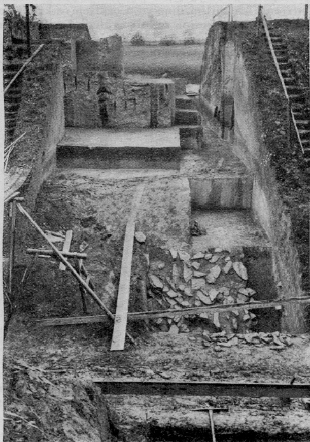
Sl. 9. Sonda v zunanem obzidju. Spredaj jarek s porušnim kamenjem, zadaj zunanja stena obzidja in njegova konstrukcija

Tretja slovanska doba ima najnaprednejši značaj, čeprav v načelu razdelitev posameznih prostorov in torej tudi obseg gradišča ostane ne-