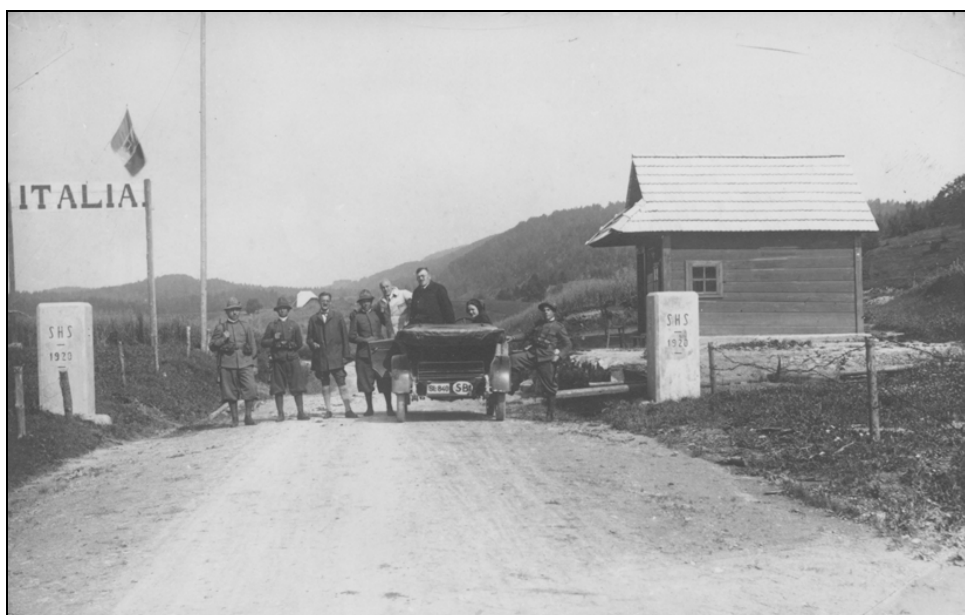
Rapalska meja pri Hotedršici.