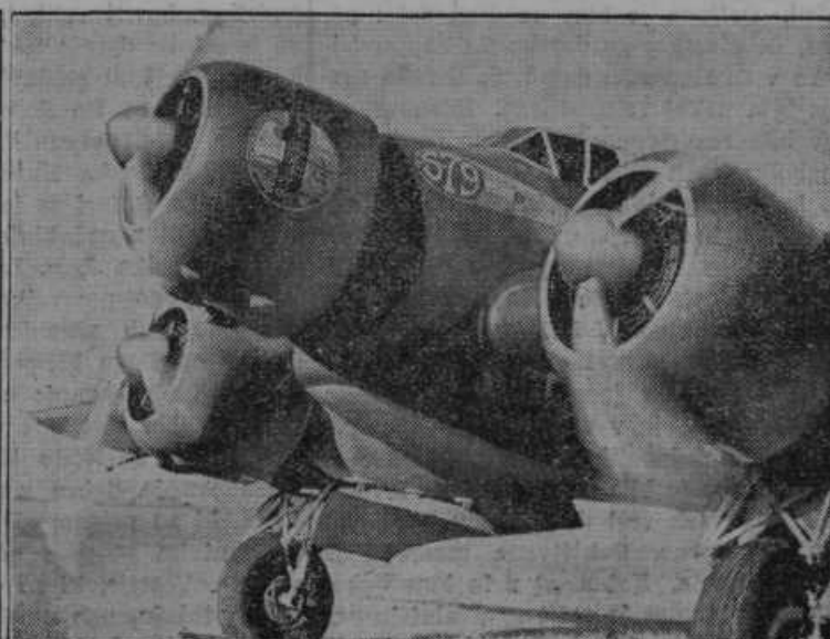
Levo: Edino bojno letalo, katerega poseda Abesinija. — Desno: Najhitrejše italijansko bombno letalo.