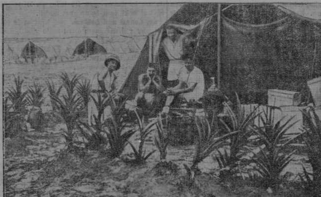
Po izkrcanju prebivajo italijanski vojaki zunaj na prostem pod šotori.