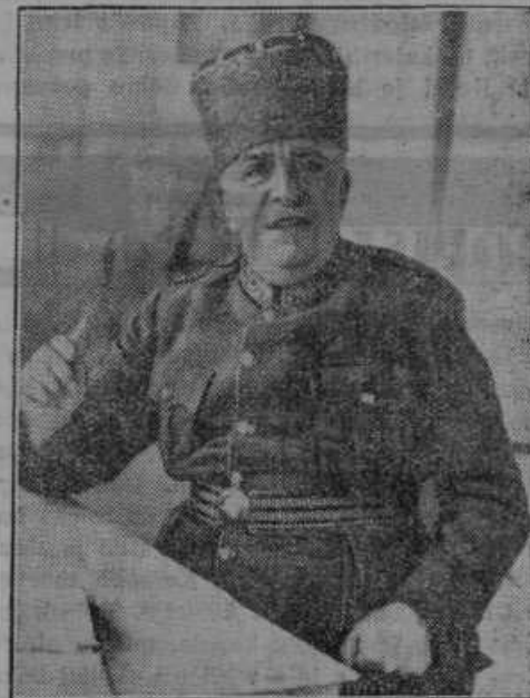
Turški general Wahib paša je bil imenovan za vrhovnega poveljnika abesinskih čet.