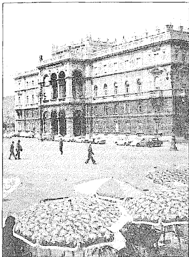
Sede del CRLN a Trieste in Piazza Unita' dal 1. maggio al 12 giugno 1945.

Sedež PNOO v Trstu na Trgu Unita' od 1. maja do 12. junija 1945.