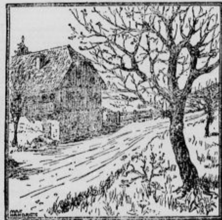
Kje je kmetovalec?