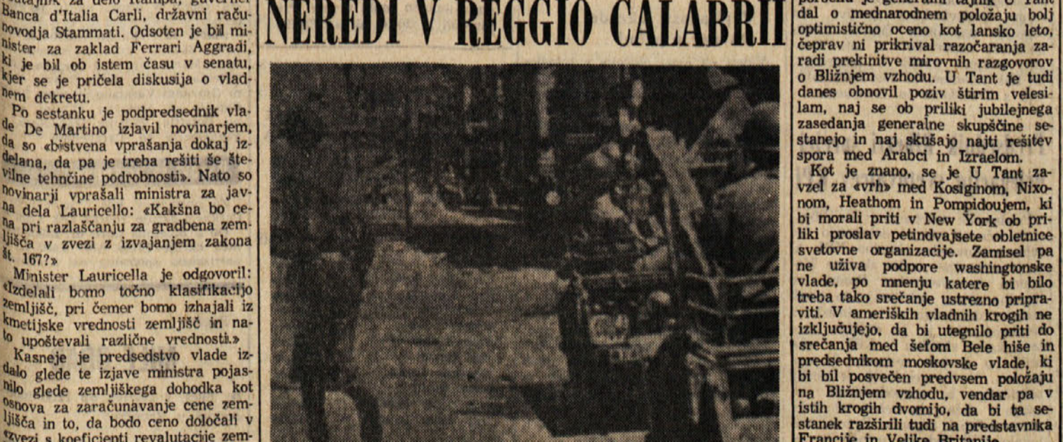
Policija med demonstracijami, ki so bile v ponedeljek med novo splošno študentsko stavko

REGGIO CALABRIA, 15. — Tudi danes je prišlo do resnih izgradov in do spopadov med policijo in demonstrantji, čeprav so večer razglasili spremiritev v zvezi z današnjo tradicionalno procesijo «Marije tolnažne». Stavka se je tudi danes nadaljevala in je bilo v središču mesta vse zaprto, na periferiji pa je bilo odprto več trgovin z živili.