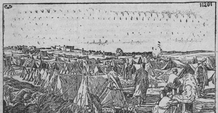
Lager der geflüchteten serbischen Truppen auf Korfu.

Za časa zmagovitih naših bojev na Srbskem in v Albaniji bilo je jedro srbske armade uničeno. Le par tisočev nam tako strupeno sovražnih, vendar pa junaških čet zamoglo se je rešiti pred uničenjem. Grozovita kazen božja zadelja je srbsko kraljemorilsko državo; vsled vse-slovanskega fanatizma voditeljev te zločinske države moralo je srbsko ljudstvo skoraj poginiti. Listi prinašajo grozovite posameznosti o koncu poražene srbske armade. Na tisoče napol otročjih mladeničev, preoblečenih v srbske uniforme, pomrlo je od lakote in napora. Kakor rečeno, rešilo se je le par tisočev srbskih vojakov. Njih zavezniki an-