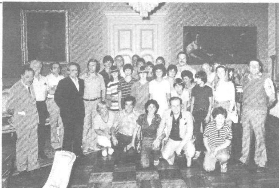
S sprejema pri predstavnikih mesta Parme

Svet skupščine krajevne skupnosti MURGLE daje v 30 dnevno javno razpravo