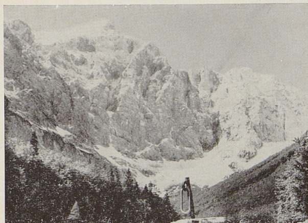
Čisti in čvrsti Julijci

Zdaj pa — molčimo, dan je preč. O hvala vam: odkritega srca smo govorili, razvedrili si duha. Že sonce manjša pekočino... studeneč pel mi bo v dolino, a vsak korak bo bolj boleč.