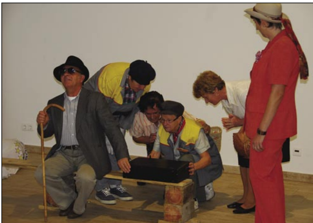
Gledališka skupina Veseli pajdaši je zidala ram z glažojne

Porabsko kulturno in turistično društvo Andovci je 1. decembra organiziralo kulturni večer, gde je nastopila gledališka skupina Veseli pajdaši z nauvo igrov Ram z glažojna. Za taše programe je te čas najbavkši, zato ka v petoj vöri je že tak kmica pa venej