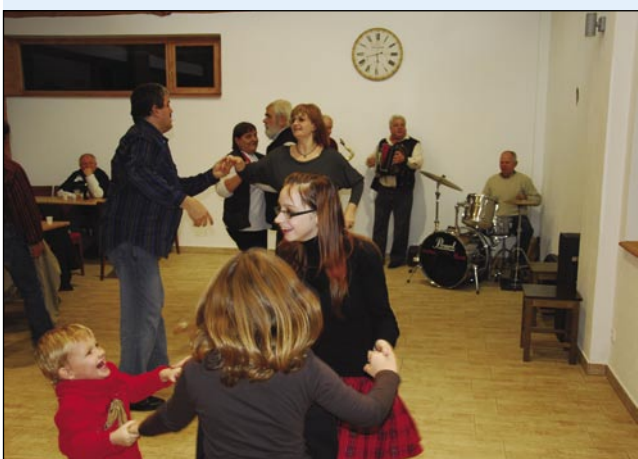
Plesali so mali, mladi pa malo starejši

večer smo sami pajdaške bili, gnauk Veseli pajdaši, te Stari pajdaši pa vsi mi, drugi kak publika, šteri smo tak pa tak pajdaši. Kulturni večer se je začno z igrov, gde so nam Veseli pajdaši nutpokazali, kak se leko eden ram gorzozida iz glažojne. Tau je taši ram biu, šteroga je nej vido vsakši, samo tisti, steri so nej meli greje. Gratala je s tauga včasim velka rabuka, zato ka