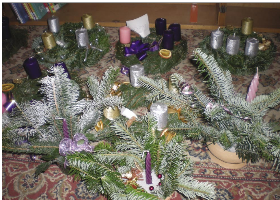
Napravljeni vejnci pa drugi okraski

rauže napravljani. Nejsmo meli penez, depa smo na stoli vsikdar kakšo svejčo vužgali« - so tapravili Anuš néni pa dale delali z brojcov, raužami pa pantlikami.