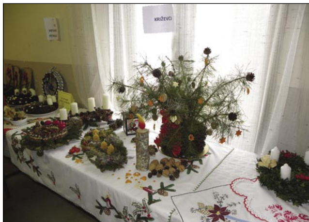
Del razstave adventnih venčkov