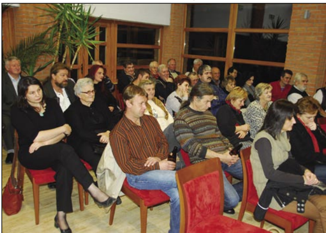
Porabci pa Goričanci

že tō nejga nišoga dela. Lidgé so etak pred adventom ešče meli gnauk priliko, ka se malo veselijo, pa če so steli, so leko plesali tō, zato ka za muziko so se Stari pajdaši poskrbeli. Tak ka tē