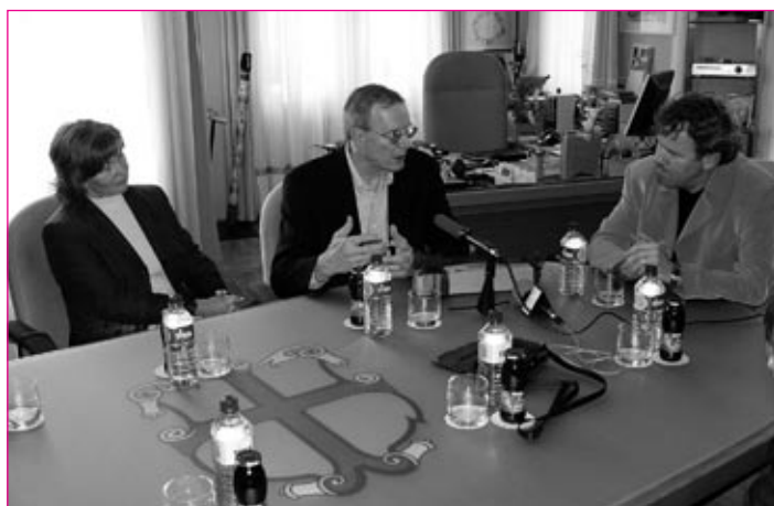
Skromnost in zavedanje pomena timskega dela odlikujeta znanega ameriškega kirurga L. Albrighta (drugi z leve).

5. junija je priznanega ameriškega kirurga sprejel župan MO Ptuj, mu čestital za opravljeno delo in se mu zahvalil.