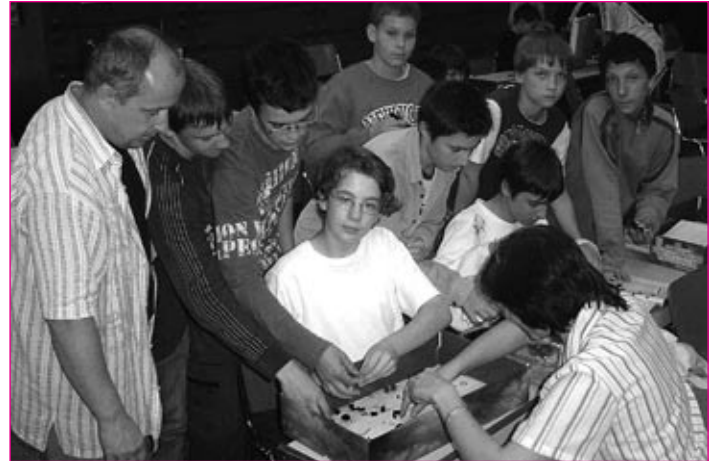
Učenci in mentorji iz OŠ Cirkovce, OŠ Ljudski vrt in OŠ Videm pri Ptujju pri sestavljanju zmagovalnega robota.

S ptujskega območja so se državnega tekmovanja udeležile ekipe osnovnih šol: Breg, Olge