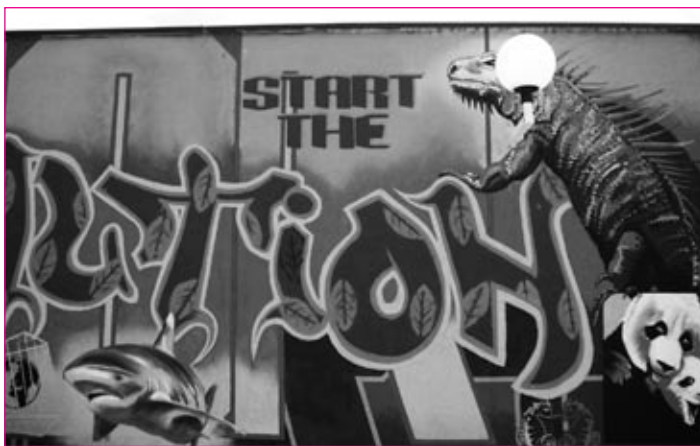
Mladi se danes vse bolj zavedajo okoljske problematike, na fotografiji slika enega izmed udeležencev natečaja.

Med poletnimi počitnicami se bo projekt celo nadaljeval na drugih lokacijah. Tako bi najrazličnejše grafite lahko zasledili še drugod po mestu in okolici. Znano je namreč, da mladi s pomočjo tovrstne »tehnike« radi izražajo svoje nezadovoljstvo z razmerami v družbi. Velikokrat njihovi grafiti pomenijo tudi klic na pomoč ali opozarjajo na probleme, ki bodo zaradi nevestnega ravnanja ljudi v prihodnosti prinesli nepredvidene posledice za širše okolje.