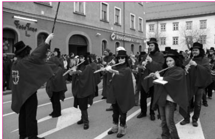
Pihalni orkester Ptuj vztrajno in vzorno skrbi za nadaljevanje bogate preteklosti godbenega igranja na Ptuju. Danes šteje šestdeset članov.

Zelo različna. Nekateri imajo nekaj razredov glasbene šole, drugi so končali srednjo glasbeno šolo. Imamo pa kar nekaj študentov glasbe in tistih, ki