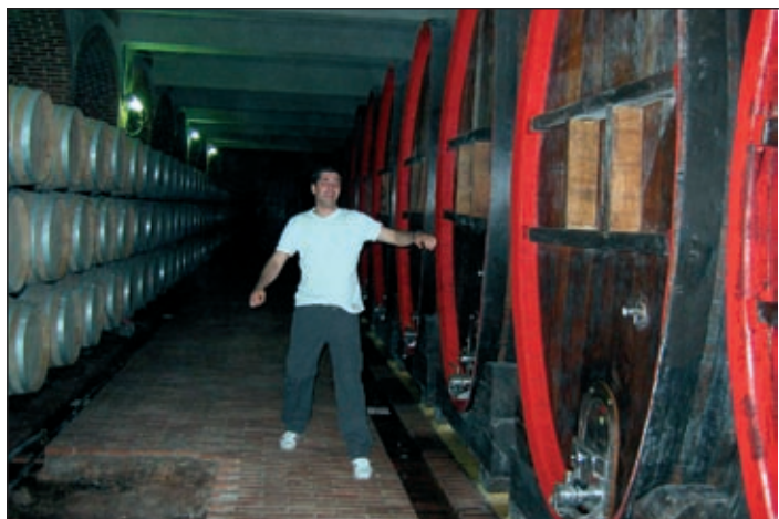
Letno pridelajo 85.000 ton grozdja, od tega ga predelajo v 35 milijonov litrov vina.