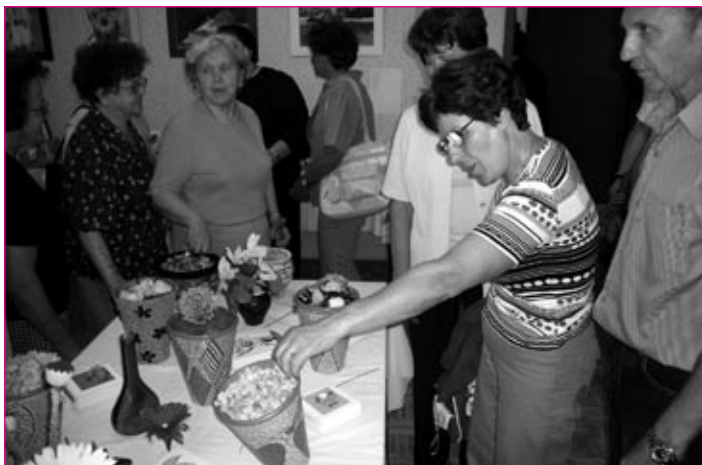
Razstava celoletnih aktivnosti društva Optimisti Ptuj

V društvu nudijo tudi merjenje krvnega tlaka in holesterola, za kar jim je lekarna Toplek podarila ustrezen aparat. Tako imajo starejši možnost, da namesto čakanja v zdravstvenem domu izmerijo krvni tlak kar na sedežu društva na Rimski ploščadi, ob sredah ob 9. uri, kjer jim pri tem pomaga usposobljena medicinska sestra.