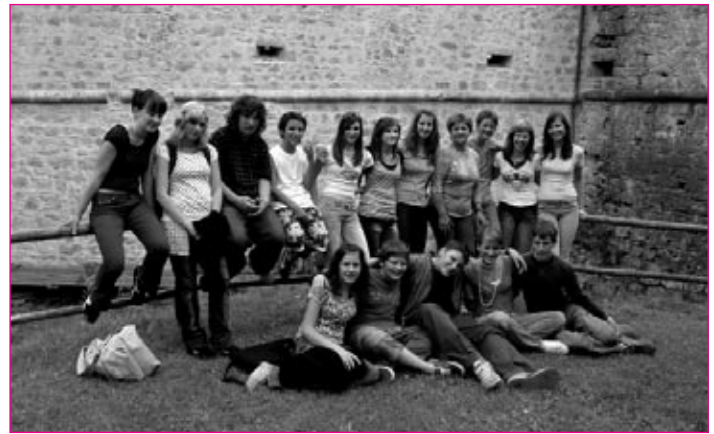
Ministrstvo za okolje in prostor ter Helios sta nagrajence idejnih zasnov vodnih učnih poti povabila na enodnevno srečanje v Žužemberk.

kot Eko šola, uporabili podatke iz raziskovalne naloge za idejno zasnovo ptujške vodne učne poti. Ogleдали smo si vse navedene vodnjake in izbrali tiste, ki danes seznanjajo obiskovalce z bogato zgodovino vodnjakov na Ptujju, z načinom izgradnje, s pomonom vodnjakov kot vodnim virom, s skrbjo okolja, da se ohranijo obstoječi vodnjaki, z zgodovinsko in etnološko vrednostjo vodnjakov, z načinom življenja nekdanjih prebivalcev ter vodnjakom kot statusnim simbolom. V vodno učno pot smo vključili vodnjake na dvoriščih pomembnih srednjeveških zgradb (minoritski samostan, nekdanji dominikanski samostan, Mali grad), nekdanje javne vodnjake (na Vodnikovih, Prešernovi ter Raičevi ulici), lepo ohranjene vodnjake na dvoriščih nekdanjih meščanskih hiš (Zelenikova, Prešernova ter Slomškova ulica) in vodnjak na grajskem dvorišču. Predlog idejne zasnove vodne učne poti ima 10 postaj. Posamezne vodnjake smo fotografirali ter navedli po-