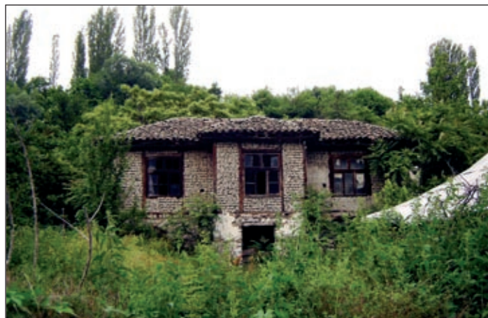
Ogled zapuščene in propadajoče vasi z značilno makedonsko arhitekturo v bližini Kvadarc, ob Tikveškem jezeru.

Ogledu je, kot je v navadi, sledila degustacija vin, nato nazaj na avtobus in na kosilo. Peljali smo se mimo Tikveškega jezera, največjega umetnega jezera v