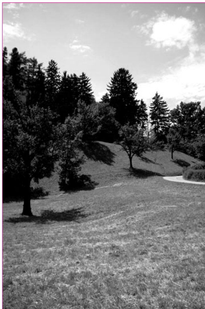
Grajski hrib je za zdaj pokošen, ostaja pa vprašanje, kakšna bo njegova podoba vse tja do jeseni.

Za septembrsko košnjo organizator obljublja, da bodo pripravili posebno tekmovanje v košnji, na katerega bodo povabili župana in lokalne politike. A. Arih nam je še zaupal: «Moram povedati, da smo tokrat županu oprostili in ga nismo posebej povabili, kajti tisti dnevi od otvoritve Puhovega mostu naprej so bili zanj naporni. Jeseni načrtujemo tekmovanje županov, zato mu bomo dali čas, da trenira in potem pokaže svoje sposobnosti, saj bo imel močno konkurenco» .