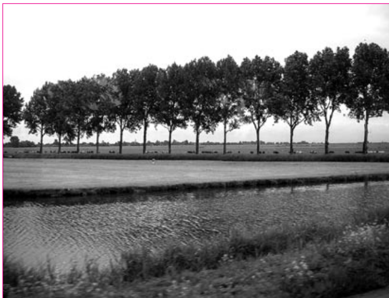
Čreda krav na paši.

Del ekskurzije so udeleženci namenili še znamenitostim Nizozemske, ki jih je obilo na vsakem koraku. Obiskali so tipično obmorsko vasico Volendam , ki je danes preurejena v ljubko muzejsko vasico z ribiško zgodovino. Nedaleč proč je zasidrana znamenita stara, lesena bojna ladja Batavia , ki je krasila tudi