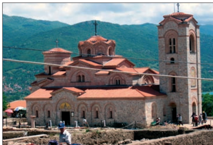
Manastir sv. Klementa v Ohridu, na vzpetini Plaošnik, je najstarejši slovanski kulturni spomenik.

Makedoniji, ki je bilo leta 1968 narejeno za potrebe namakanja vinorodnega območja in pridobivanja električne energije. Kavadarska občinska delegacija z zelo dobro razpoloženim načelnikom mesta na čelu nas je pogostila z odlično hrano na umetnem gojišču postrvi. Ker je kosilo trajalo dolgo; Makedonci namreč jejo zelo počasi, smo se pač takoj za tem odpravili še na večerjo.