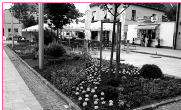
Cvetiči Varaždin - središče mesta.

Po obisku Varaždina se je delegacija vračala skozi sosednje mesto Čakovec. Bili smo presenečeni, saj smo videli, da je tudi Čakovec lepo urejen in ima v središču mesta veliko cono za pešce, kjer se lahko meščani z otroki ves dan sprehajajo.