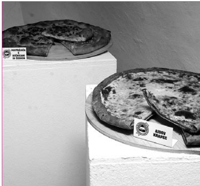
Osrednje mesto na letošnji razstavi je pripadlo Podravju, ki se je med drugim predstavilo tudi z gibanicami in pogačami.

»Organizatorji razstave opozarjajo tudi na potrebno ureditev zakonskih možnosti prodaje dobrot v okviru raznih prireditev