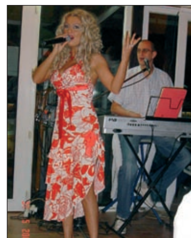
Poleg obilice hrane so nas razvajali z eno izmed svojih zvezd narodnozabavne glasbe.

S plesom, pozdravi in objemi kavadarskih predstavnikov ob-