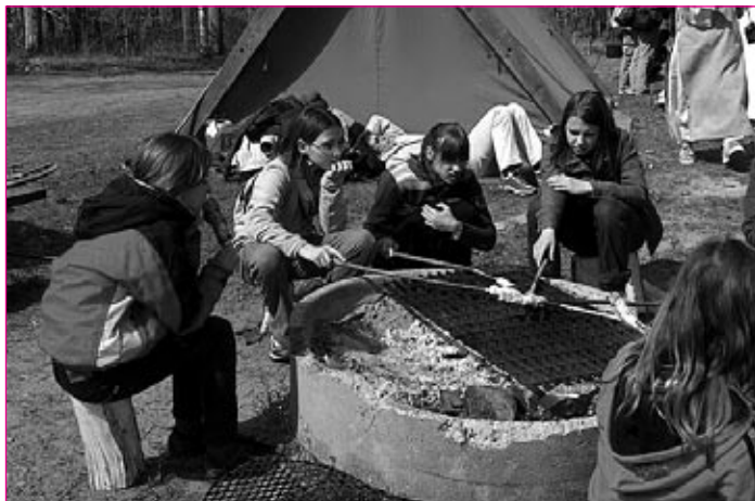
Piknik večerja ob jezeru Vänern.

Naslednje leto bodo naši učenci spet potovali na Švedsko. Takrat drugi. Za vse, ki smo potovali letos, pa je bil to sicer kratek, a nepozaben švedsko-slovenski teden.